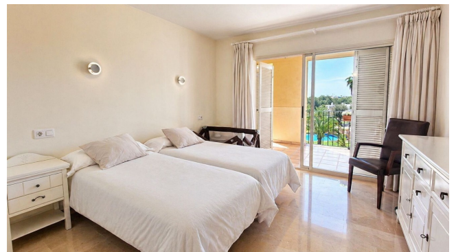
kaufen Port Adriano