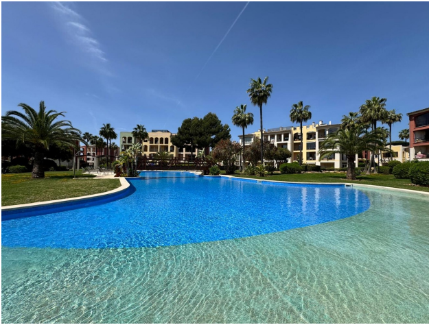
Mallorca kaufen Wohnanlage