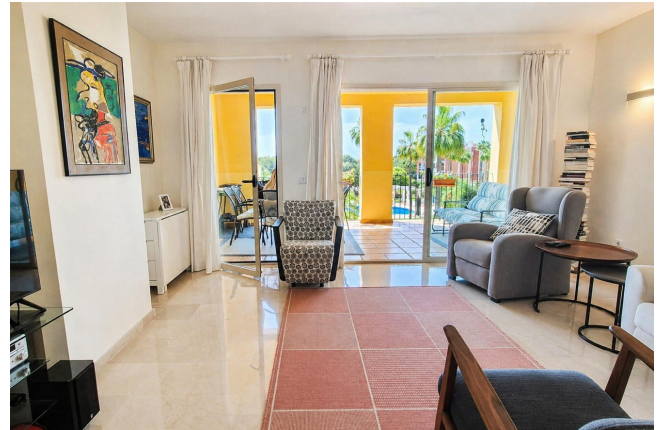
kaufen Wohnung Mallorca