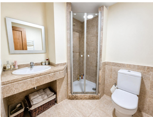
kaufen Wohnung Mallorca