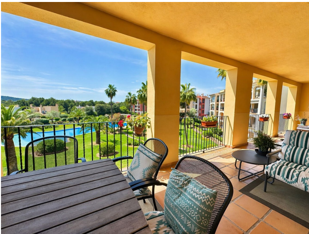
Grosse Süd Terrasse