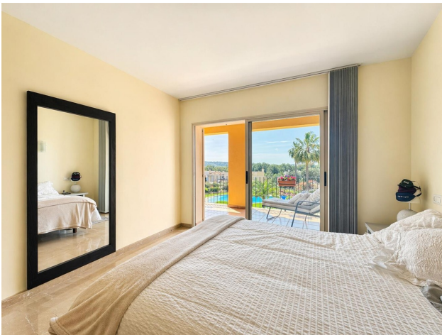
Golfplatz Wohnung kaufen