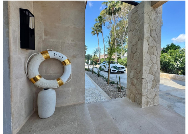
Villa kaufen Mallorca