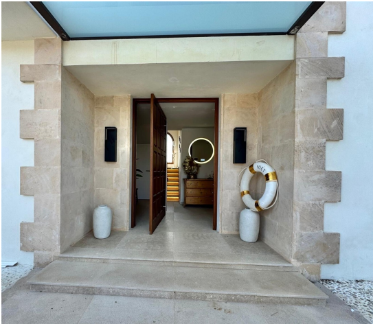
Eingang zur Villa