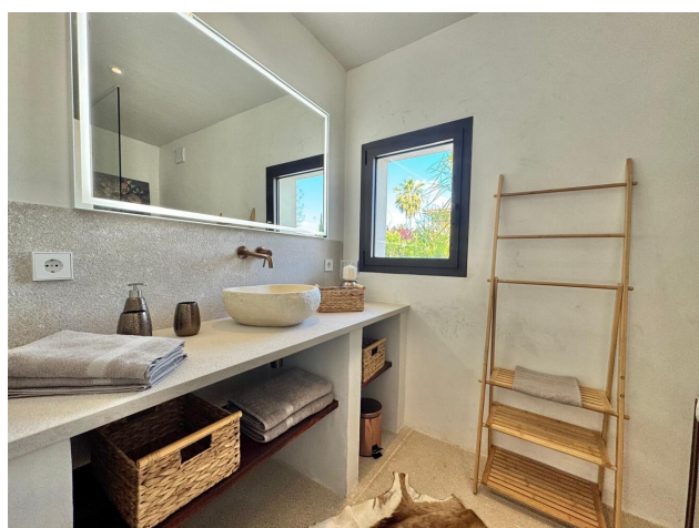
Villa mit Ferienvermietung