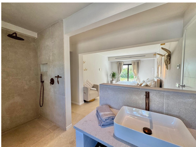
kaufen Immobilien Mallorca