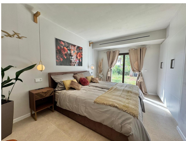
Villa mi Lizenz Ferienvermietung