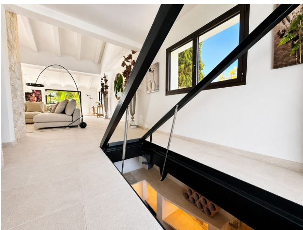
...der Weg zum Glück