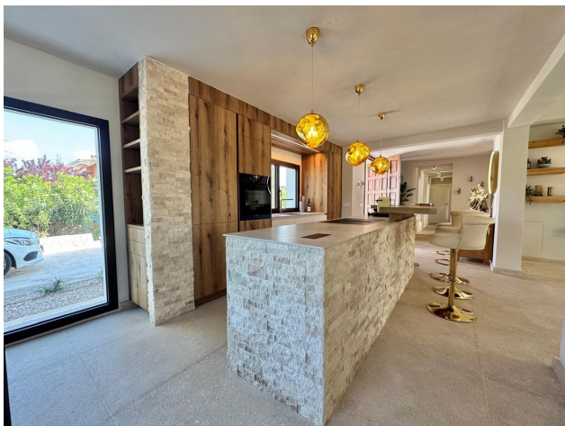
Villa kaufen Mallorca