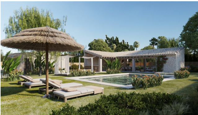
Aussenbereich Pool / in Fertigstellung