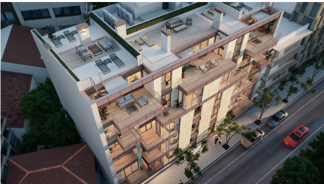
fassade von oben penthaua