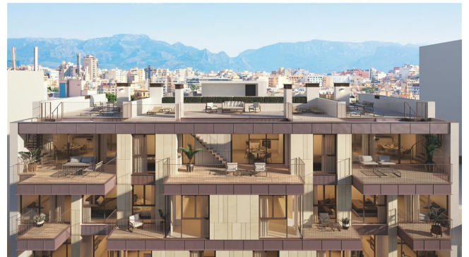
Santa Catalina kaufen