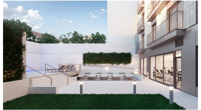
Pool und Garten