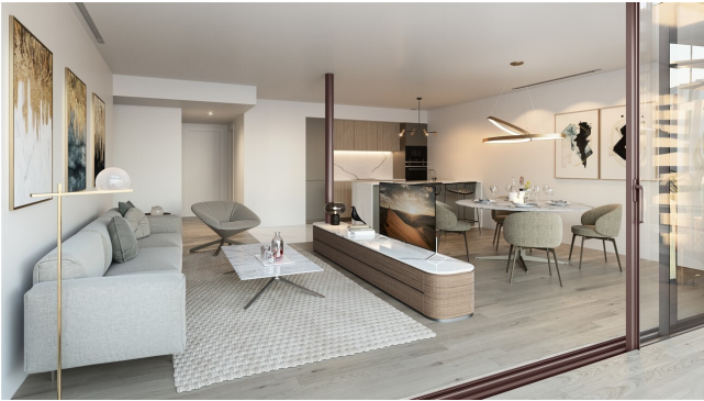
08_ VIZ20-08_PalmaMallorca_Living_01_B_F_aran (1)