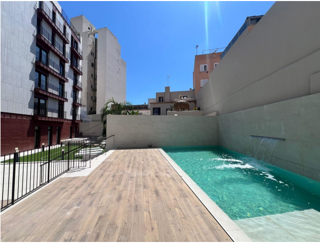
new build Palma