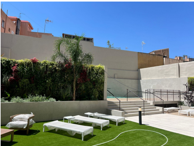
Garten und Pool