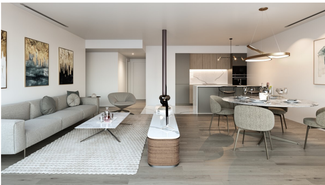
Santa Catalina Palma