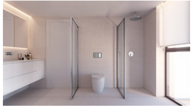
Bad beispiel 1