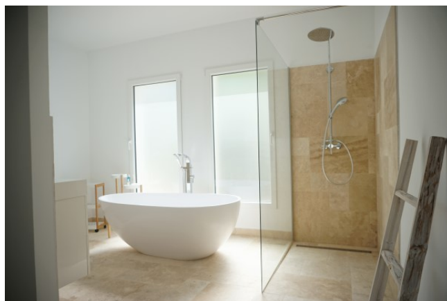
Nova Santa Ponsa kaufen