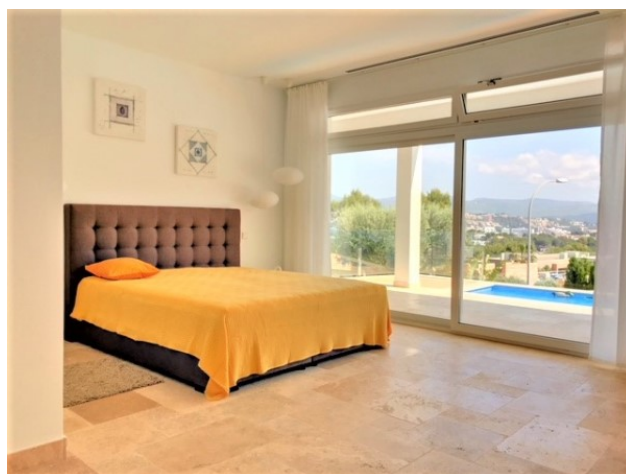
Santa Ponsa Villa