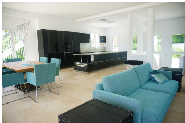
kaufen minimalistische Villa