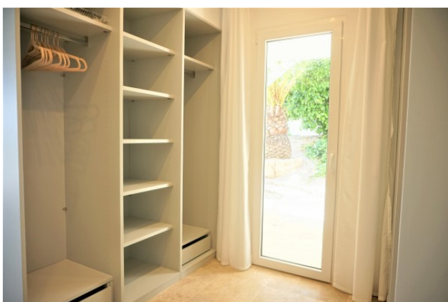
for sale Majorca