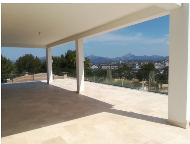
Villa Meerblick kaufen