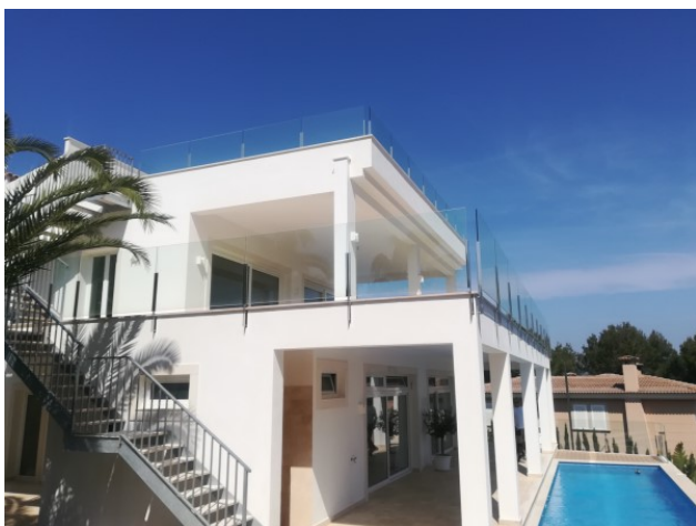
Meerblick Santa Ponsa