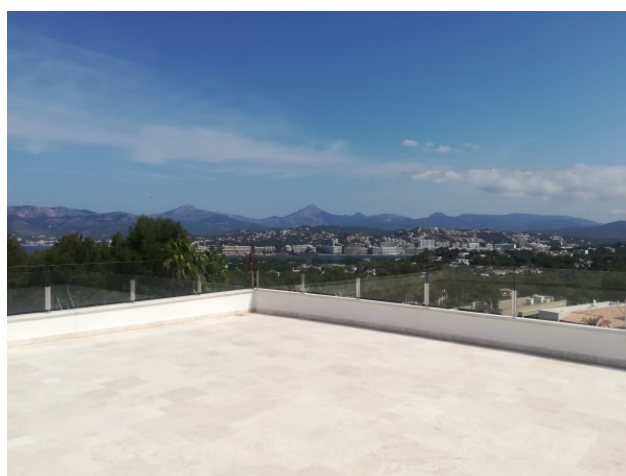
Meerblick kaufen d_20180508_010948078