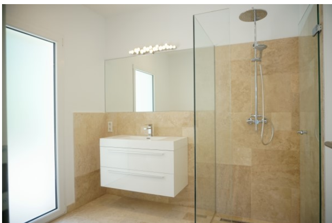
Moderne Villa zu verkaufen