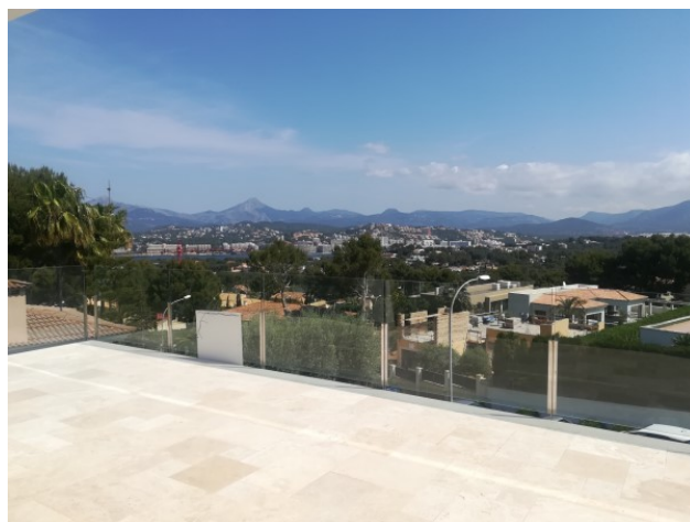
Santa Ponsa Villa