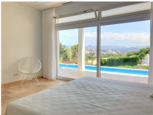
kaufen minimalistische Villa