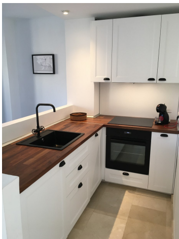
Penthaus offene Küche