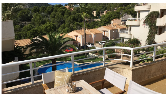
kaufen Camp de Mar