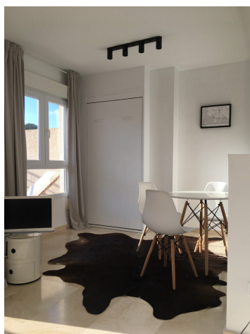
zu verkaufen Penthouse