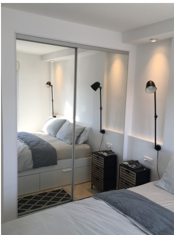
Penthaus Camp de Mar