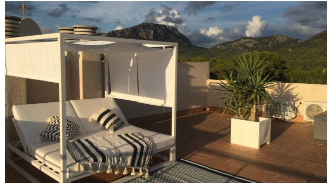
Dachterasse Camp de Mar