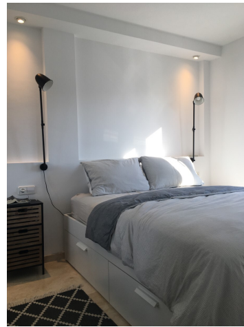
kaufen Camp de Mar