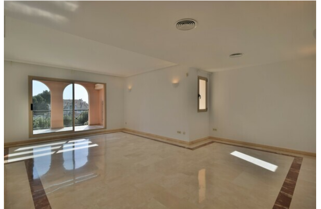
Apartement for Rent Nova Santa Ponsa