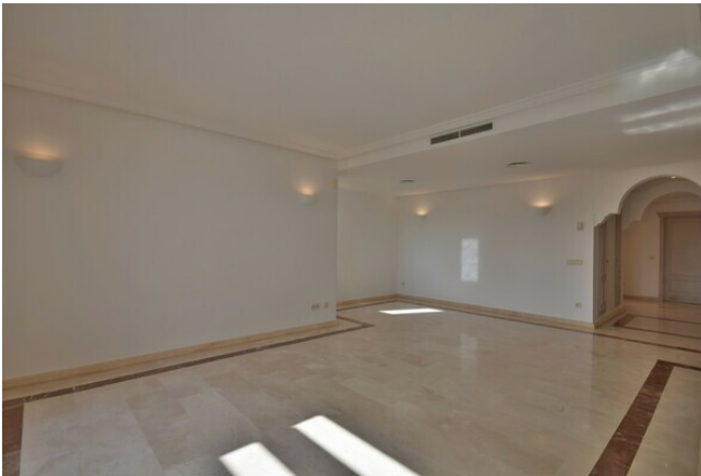
Apartamento en alquiler Mallorca