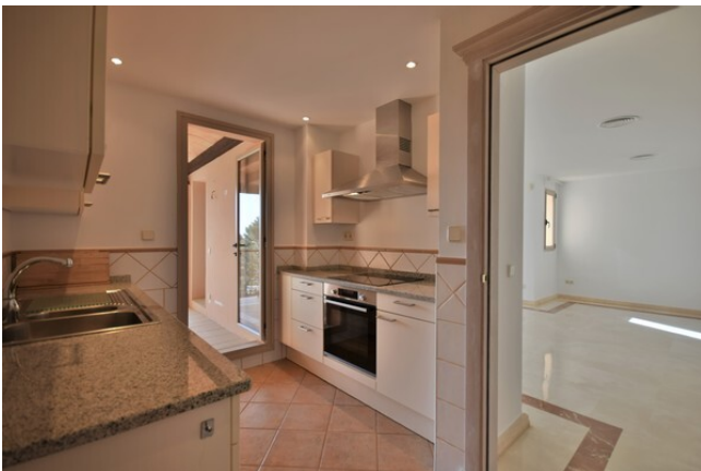
Apartamento de lujo en alquiler