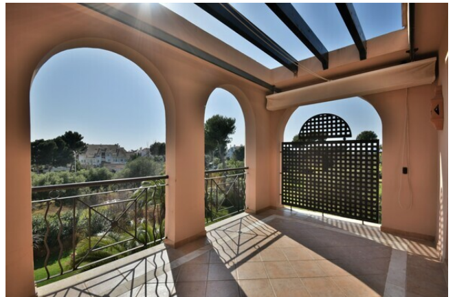
Luxus Apartment zu vermieten Mallorca