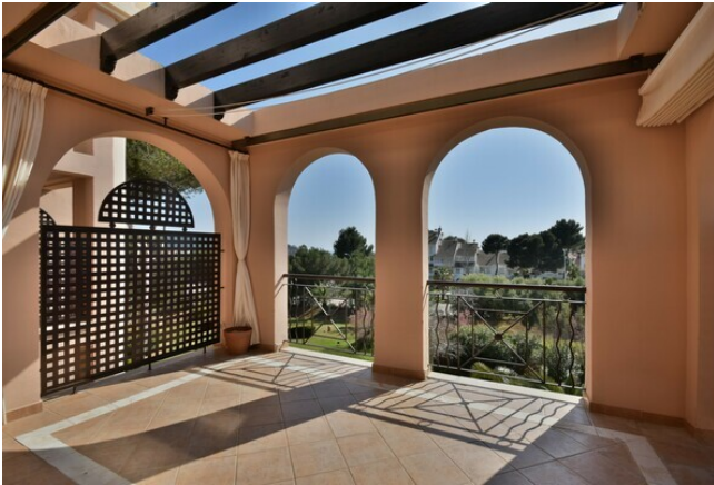
Mieten Mallorca Apartment