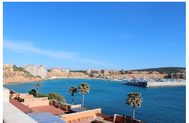
1. Linie mieten