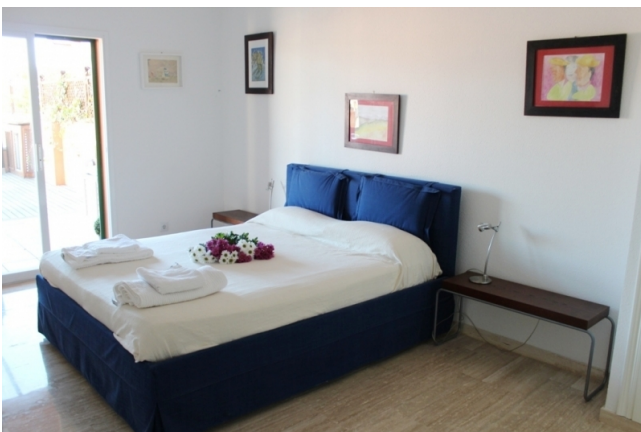
for rent Majorca