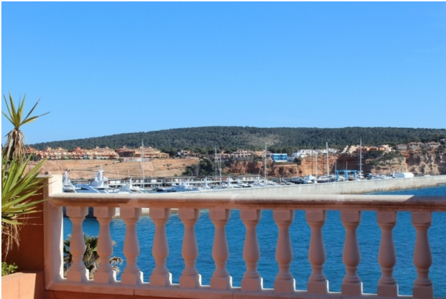
1. Linie Miete