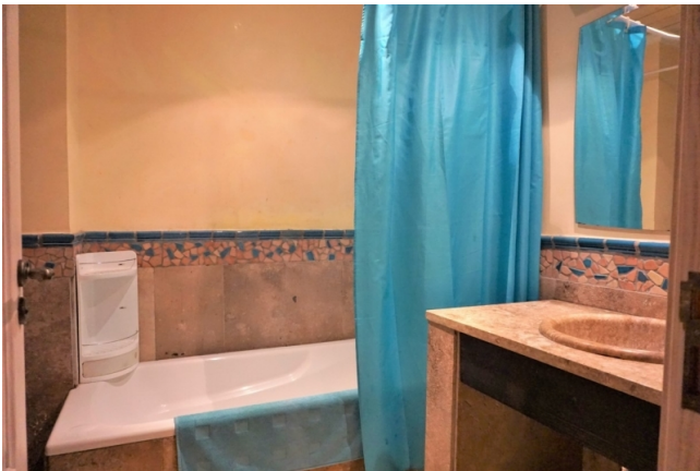
kaufen Santa Ponsa