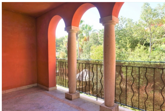
Mallorca Immobilien kaufen