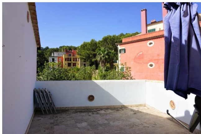
kaufen Mallorca haus