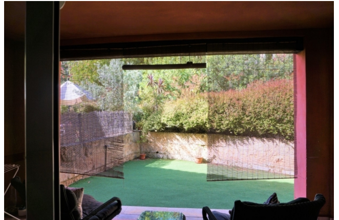
Garten Eckhaus Santa Ponsa