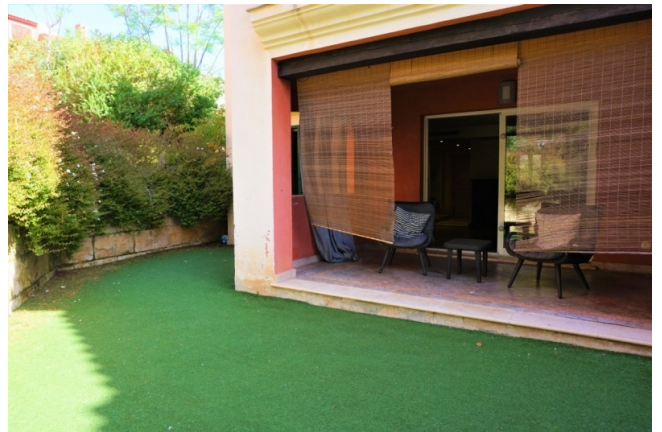
Mallorca kaufen Reihenhaus