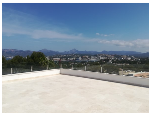
Meerblick kaufen d_20180508_010948078