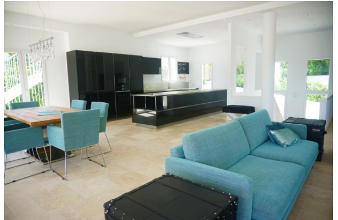
kaufen minimalistische Villa