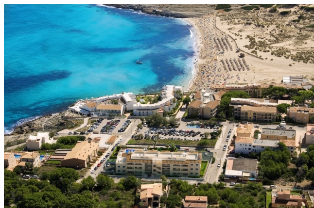
Apartamento en el jardín cerca de la playa