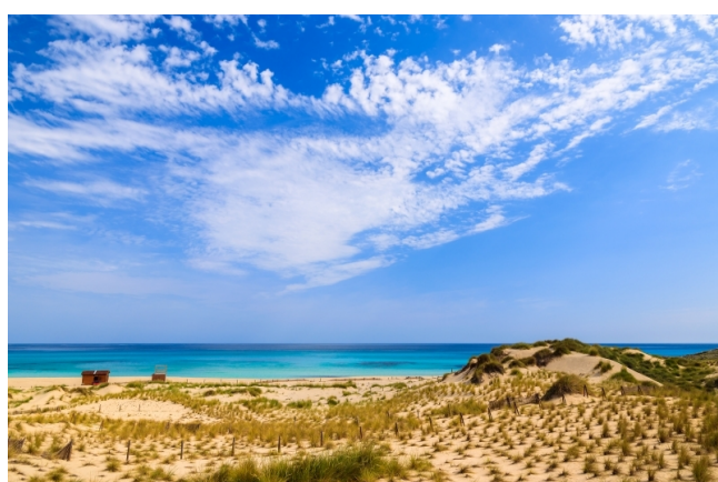
Nordeste de Mallorca bienes inmuebles