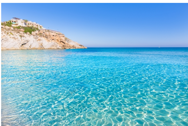
Apartamento en Capdepera