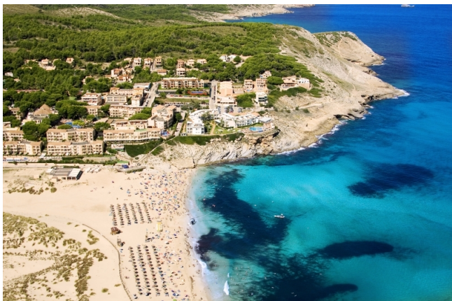
Real Estate Mallorca