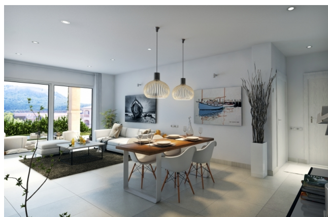
Compre un gran departamento