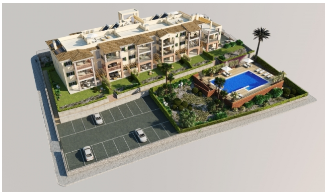
Complejo residencial Apartamentos de nueva construcción