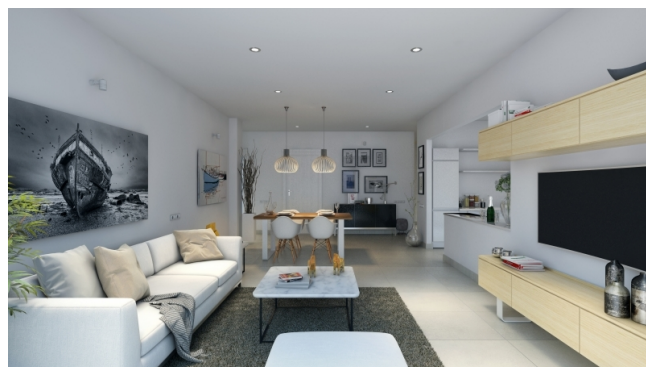
En venta en el noreste de Mallorca