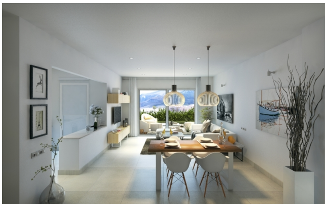
Apartamento con jardín en venta en Mallorca