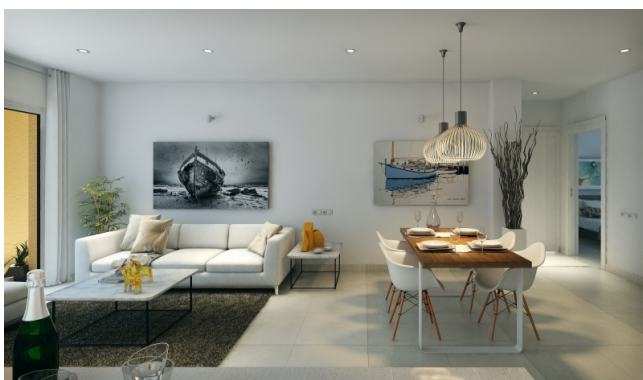
Comprar apartamento de jardín de nueva construcción