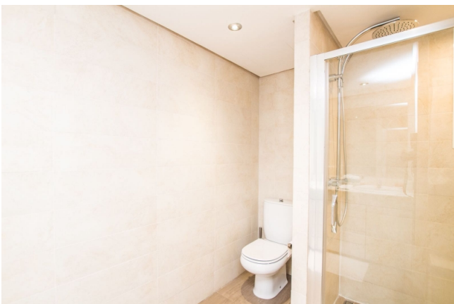
Ronoviertes Duplex mieten