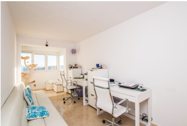
Cala Vinyas Duplex mieten