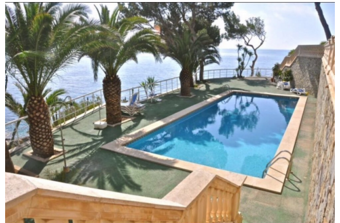
Wohnung mit Gemeinschaftspool