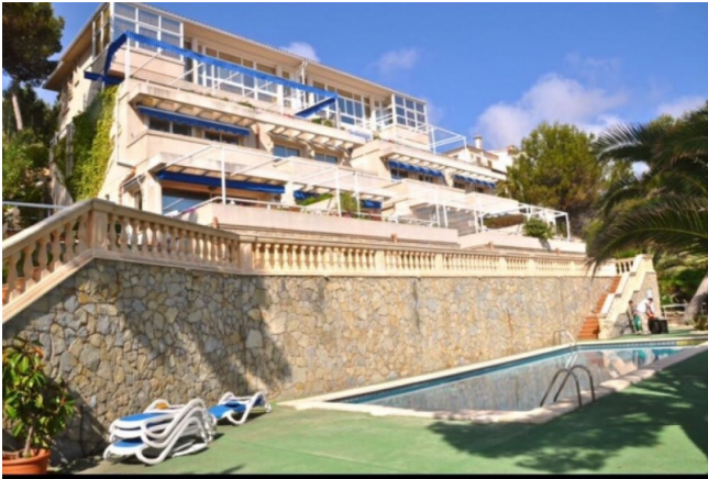
Wohnung auf mallorca