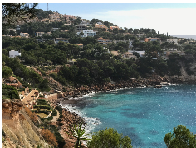
Nova Santa Ponca