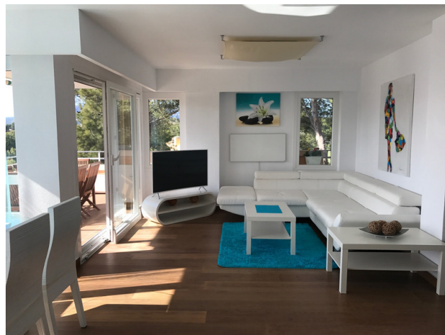
se alquila piso