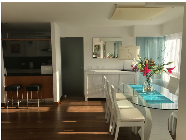
Long term renting