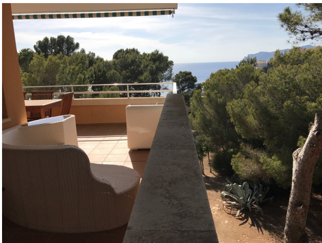
Meerblick Wohnung Mallorca