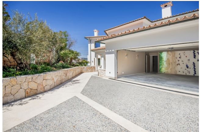
Comprar propiedad en Mallorca