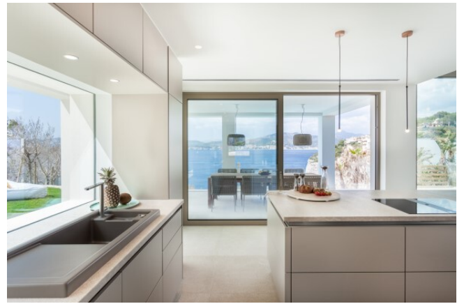
1. Linie Luxus Villa