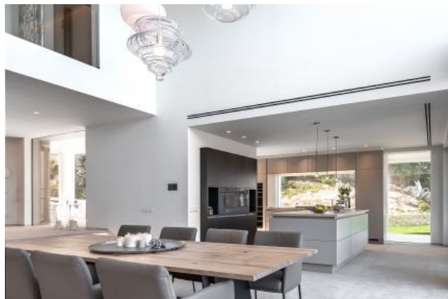
Compre una casa de sus sueños