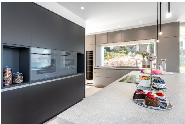
Compre una casa de sus sueños