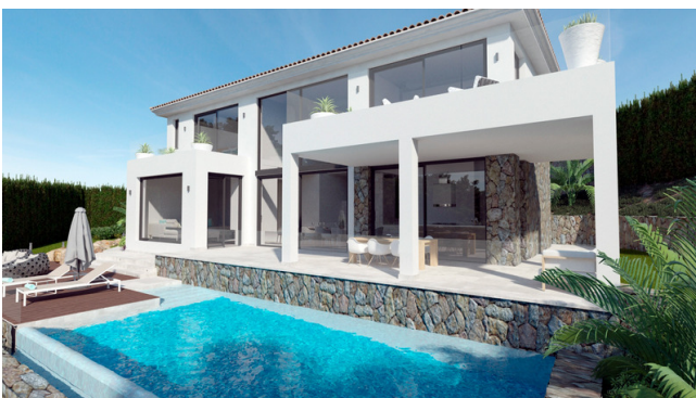
Comprar villa de ensueño