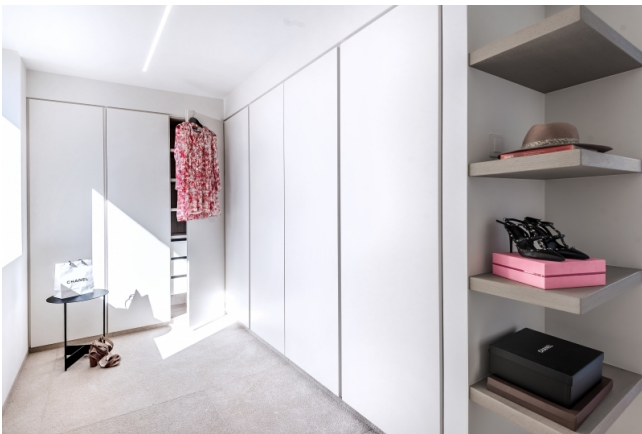
Comprar una villa