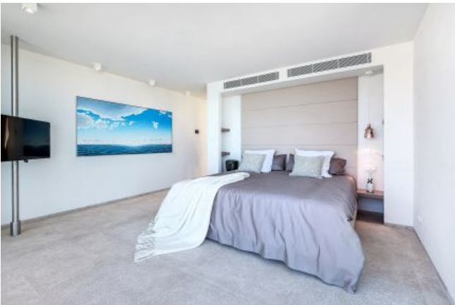
Bienes raíces Santa Ponsa