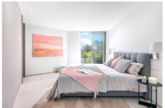
Mallorca real estate