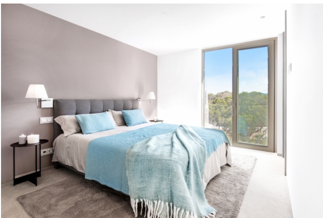
Kaufen auf Mallorca