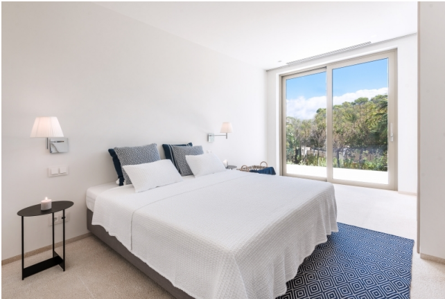
Comprar una villa