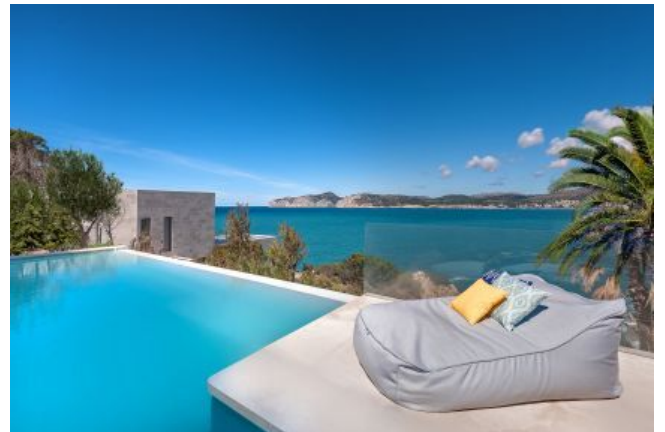
Comprar villa con vistas al mar