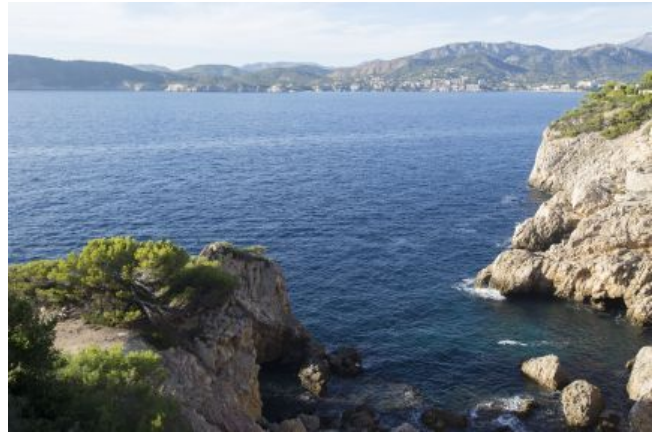
comprar en el suroeste de Mallorca