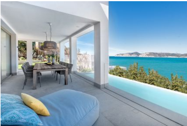
Villa de la clase extra