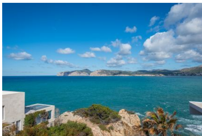
Vista al mar inmobiliaria