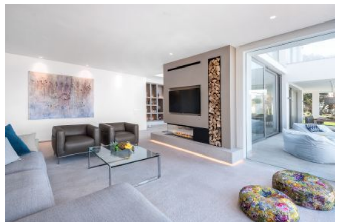
comprar 1ra linea Mallorca