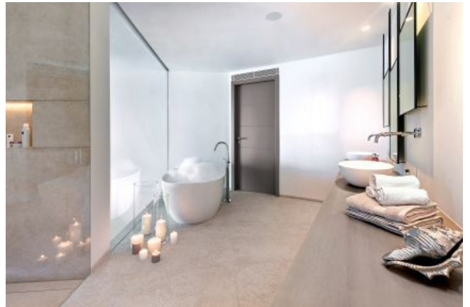
Comprar villa moderna