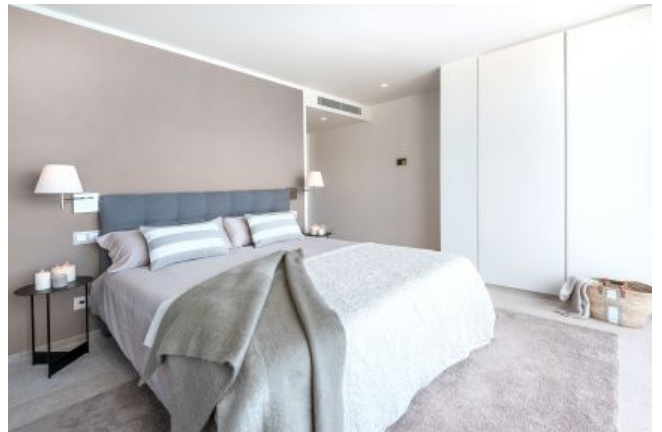
Propiedad Santa Ponsa