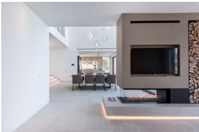
Villa con apartamento de invitados