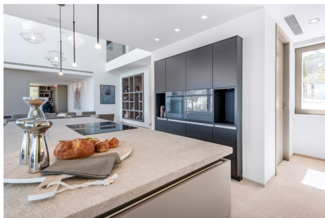
Propiedad con vistas al mar