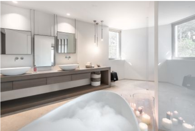
Fantástica villa en venta