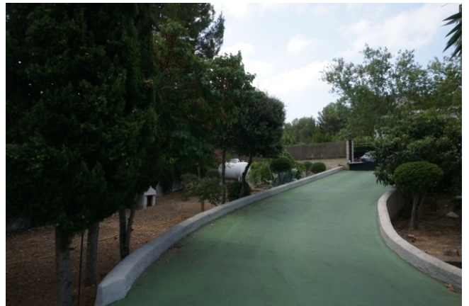
Auffahrt zum Haus