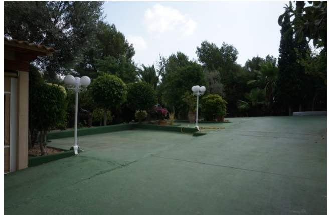
Einfahrt zum Haus