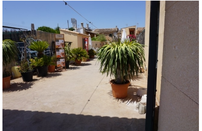
Hause mit Innenhof