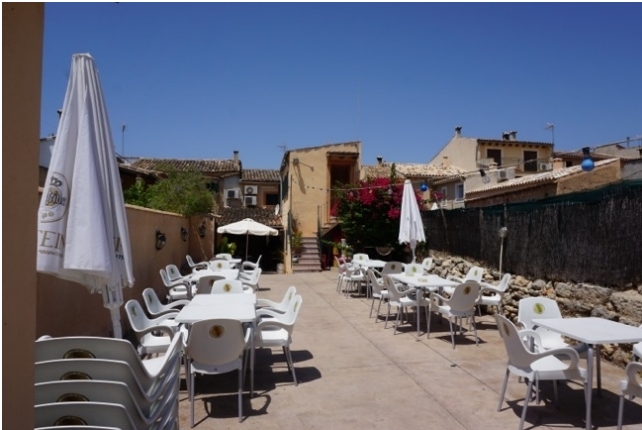
Kaufen auf Mallorca