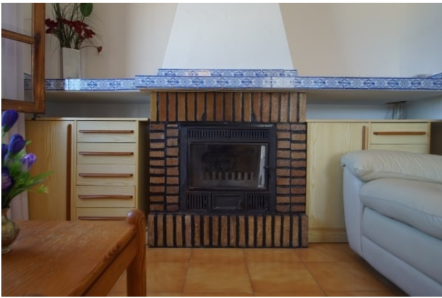
Reihenhaus mit Kamin Santa Ponsa