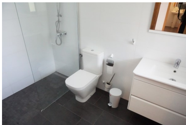
Sol de Mallorca