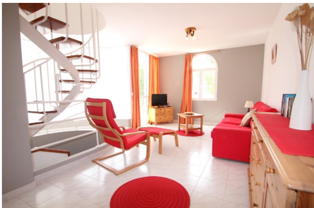
Duplex in Sol De Mallorca