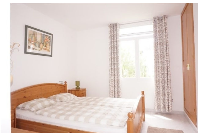
Sol de Mallorca Bad