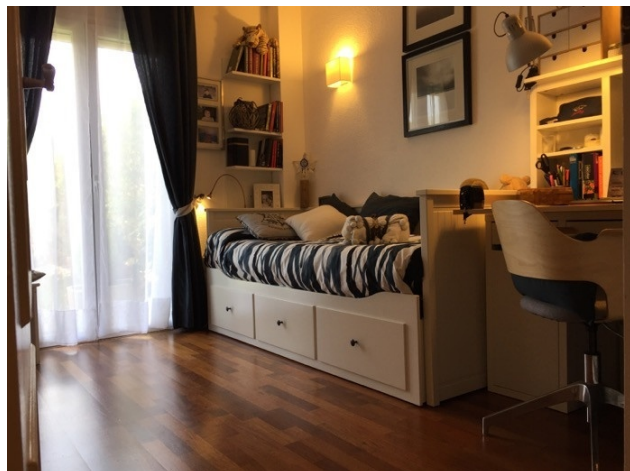
Wohnung kaufen El Toro