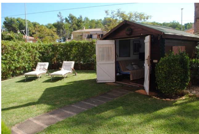
Port Adriano kaufen