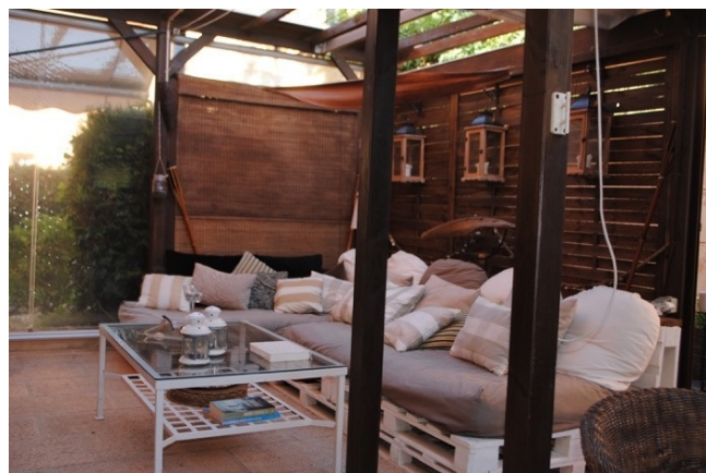
A-2340 BBQ zone