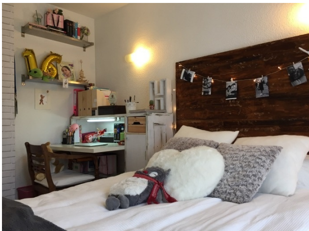
kaufen Port Adriano Village