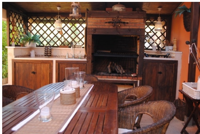
Duplex El Toro