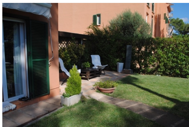
A-2340 back garden 1