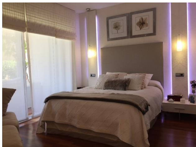
Port Adriano Village