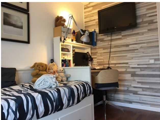
A-2340 cama 1