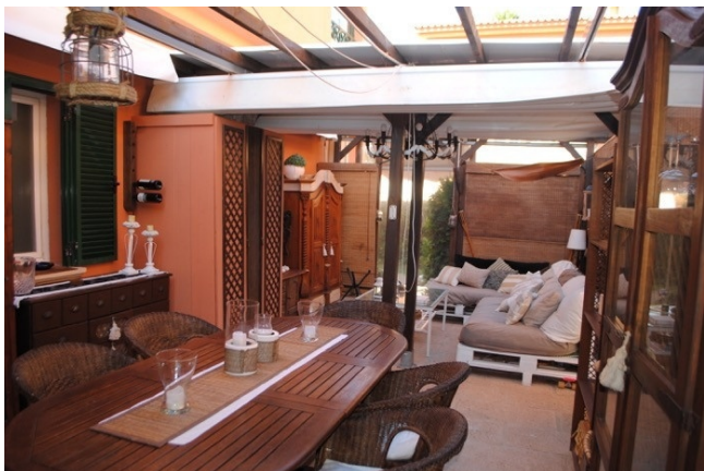
BBQ Zone Port Adriano