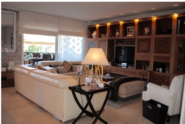
Wohnzimmer El Toro