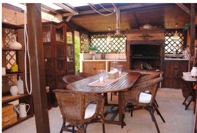
A-2340 BBQ Zone 2