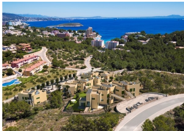
8 Lage zum Strand