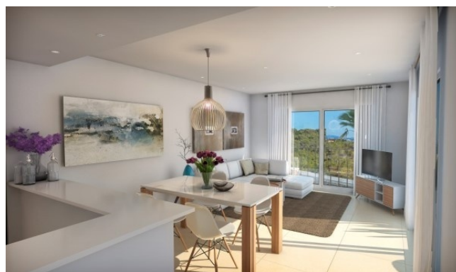
5 Wohnbereich Neubau