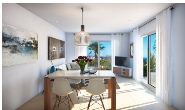
6 Essbereich Neubau