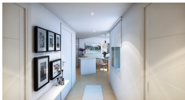
6a Flur Neubau