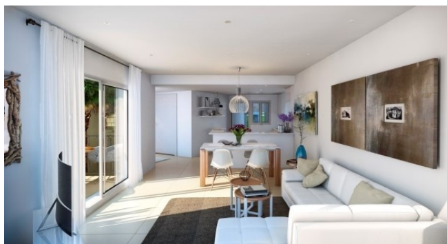
4 Wohnbereich Neubau