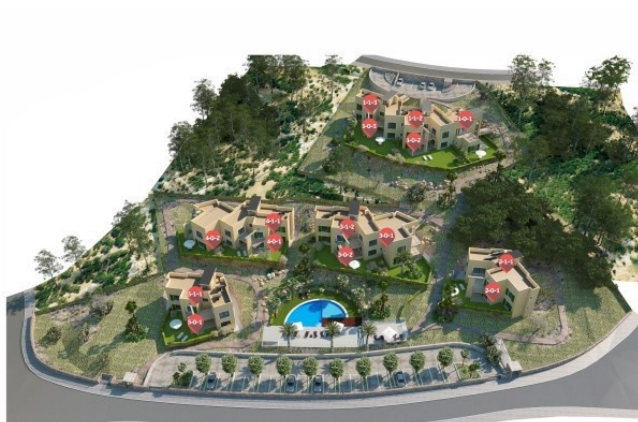
7 Lage Apartments