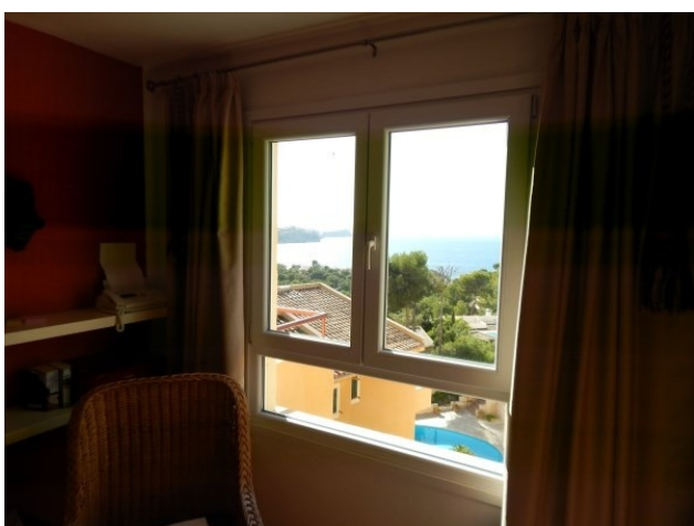
buy semi-detached house