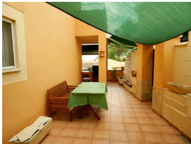
Casa en Costa de la Calma