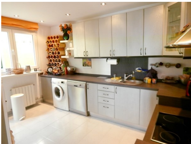
Real Estate Mallorca