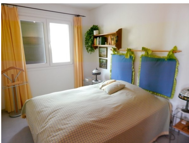
Costa de la Calma