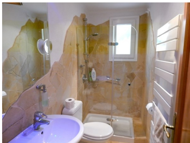
Kaufen in Coasta de la Calma