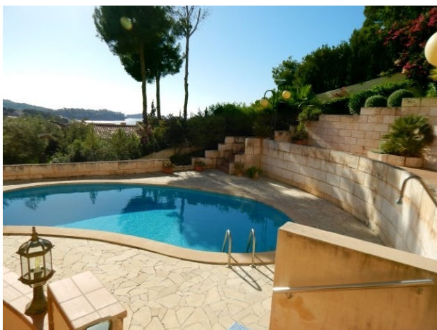
Doppelhaushälfte mit Pool kaufen