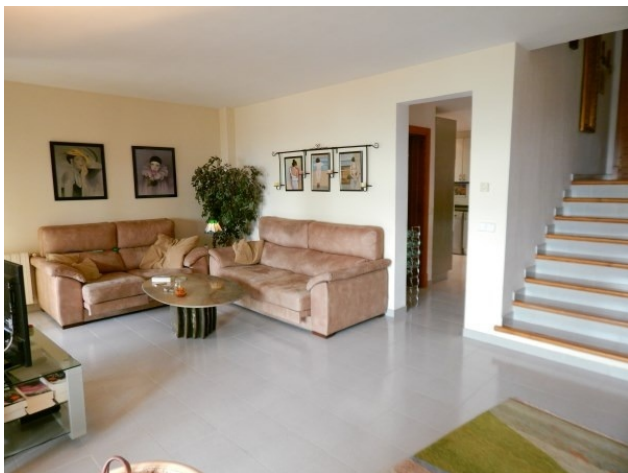
Costa de la Calma Haus kaufen