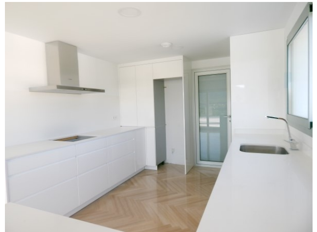
5 Penthouse Santa Ponsa