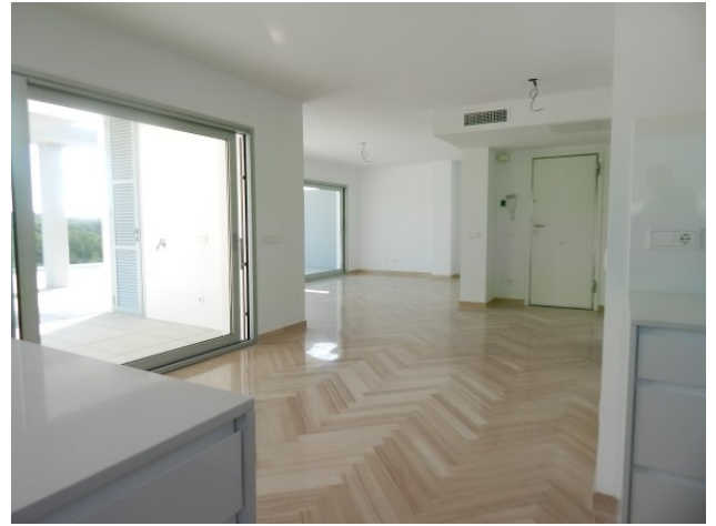
3 Penthouse Santa Ponsa