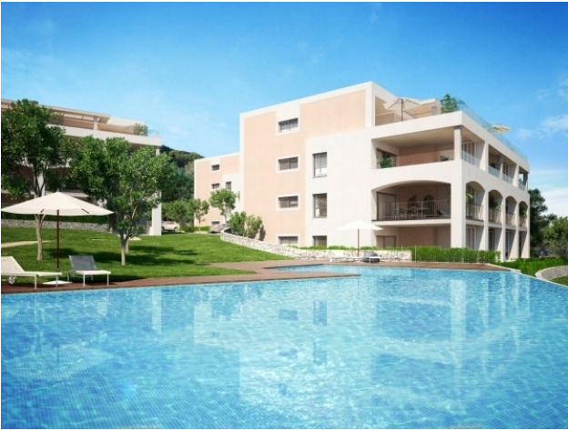
Pool Santa Ponsa