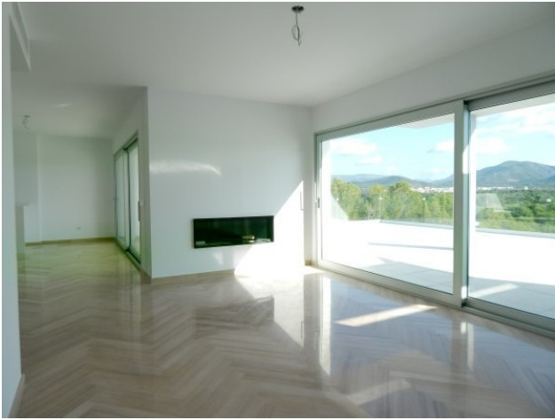
2 Penthaus Santa Ponsa