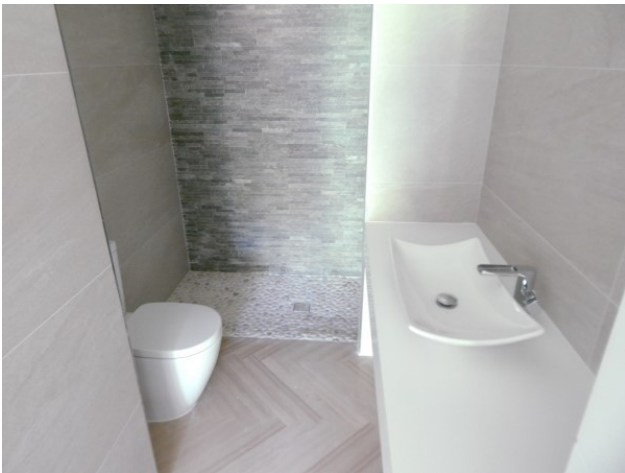
4 Penthaus Santa Ponsa