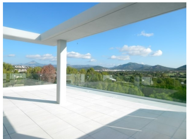
7 Penthouse Santa Ponsa