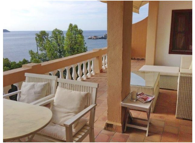
Apartment for sale Cala Fornells