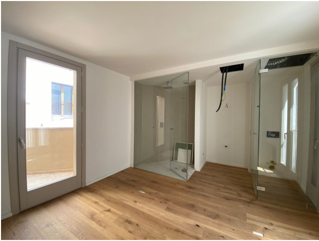
kaufen Altstadt Palma