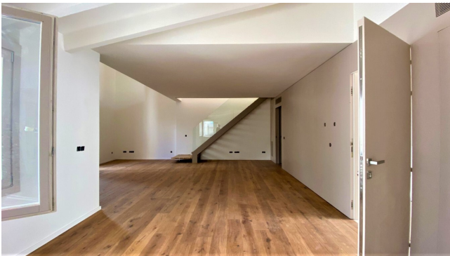
Palma Altstadt Penthaus