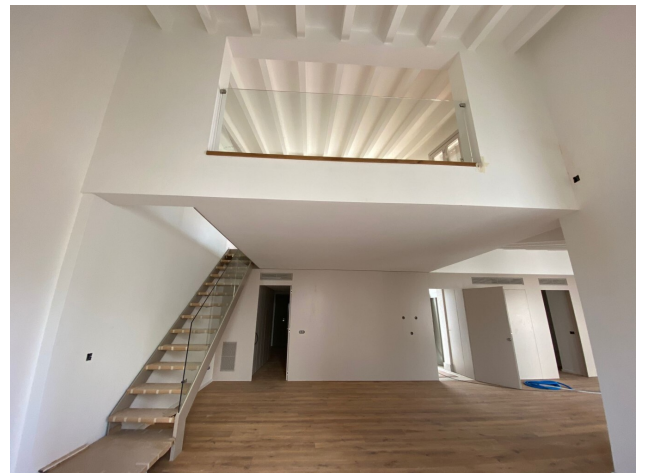
Palma Penthaus kaufen