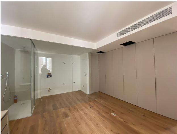
Erstbezug Penthaus Palma