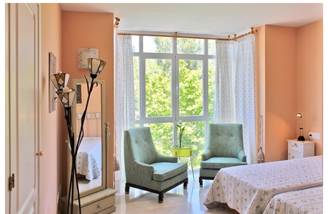
5 Schlafzimmer I