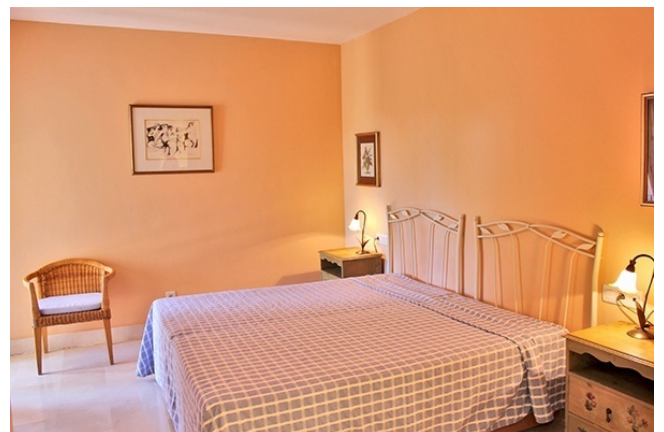
7 Schlafzimmer II