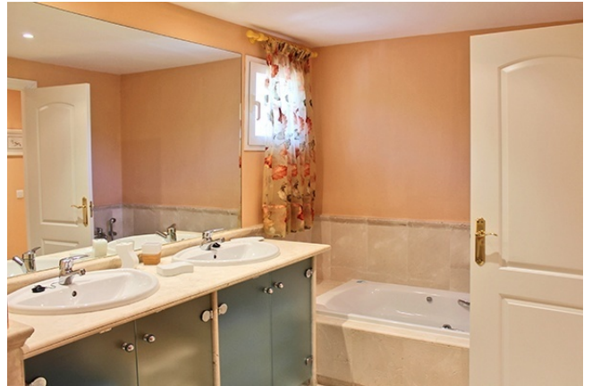
10 Bad I