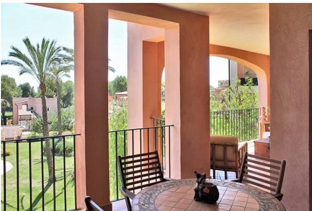
4 Terrasse II