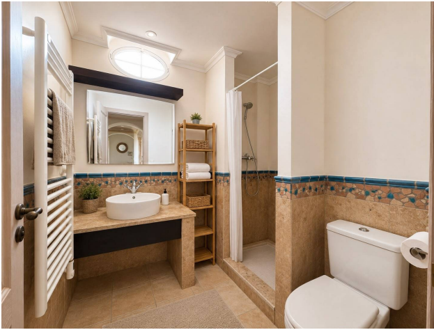
Santa Ponsa Apartment