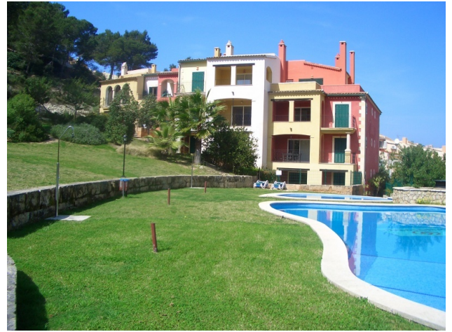
Apartment for sale