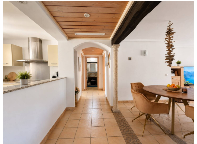
kaufen Immobilie Mallorca