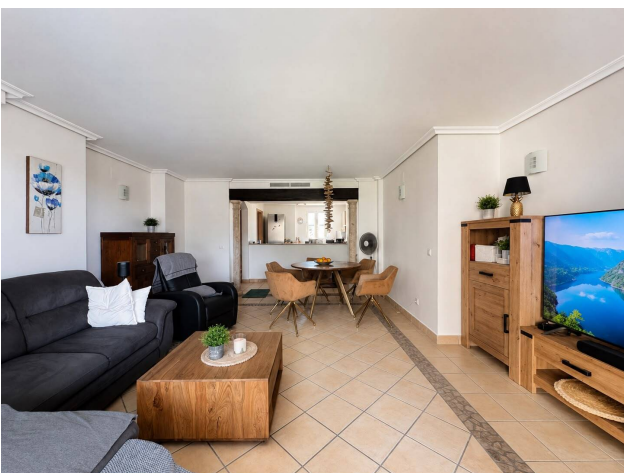
Kaufen Wohnung Santa Ponsa