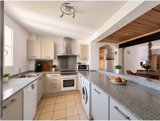
kaufen Wohnung Santa Ponsa