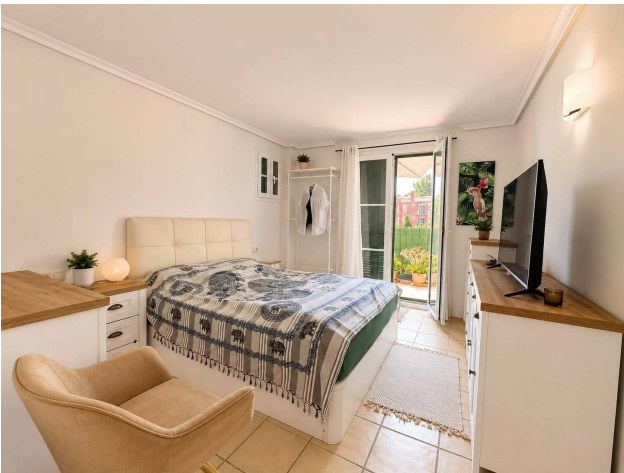
Santa Ponsa Wohnung kaufen