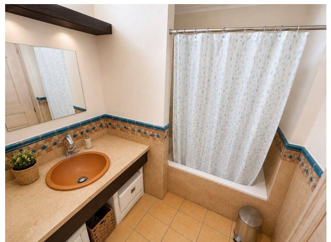
for sale Santa Ponca