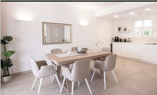
Kaufen Haus MAllorca