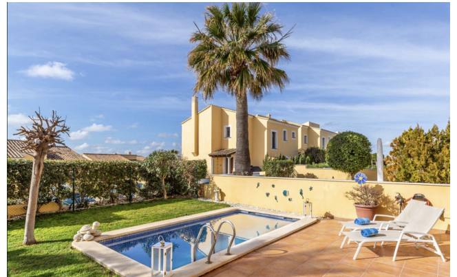
Wohnanlage Mallorca kaufen