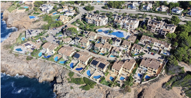
Mar del Sur