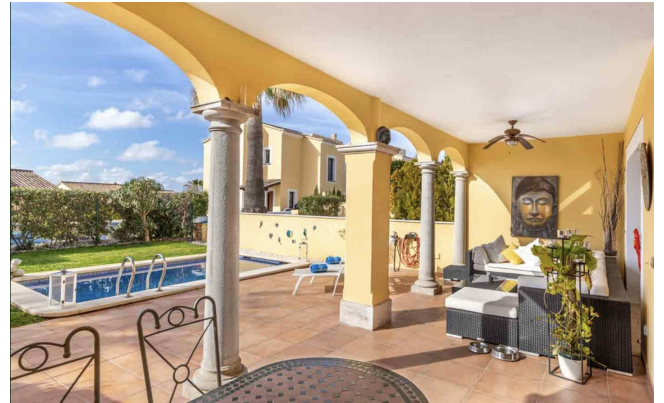
Santa Ponsa kaufen