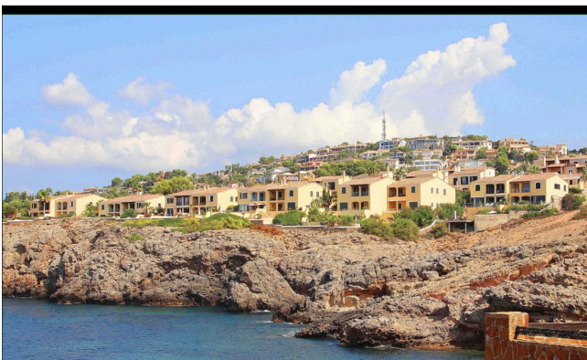
1. Linie Wohnanlage