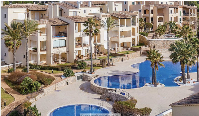
Wohnanlage mar del sur