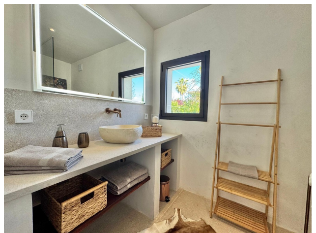
Villa mit Ferienvermietung