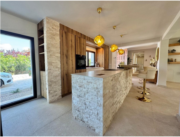
Villa kaufen Mallorca