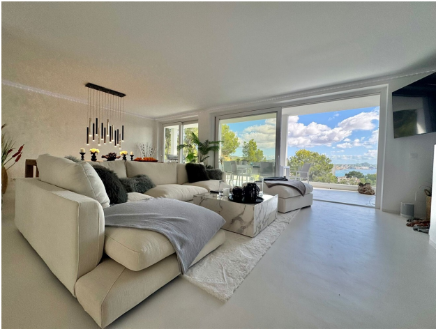
eerblick Villa kaufen