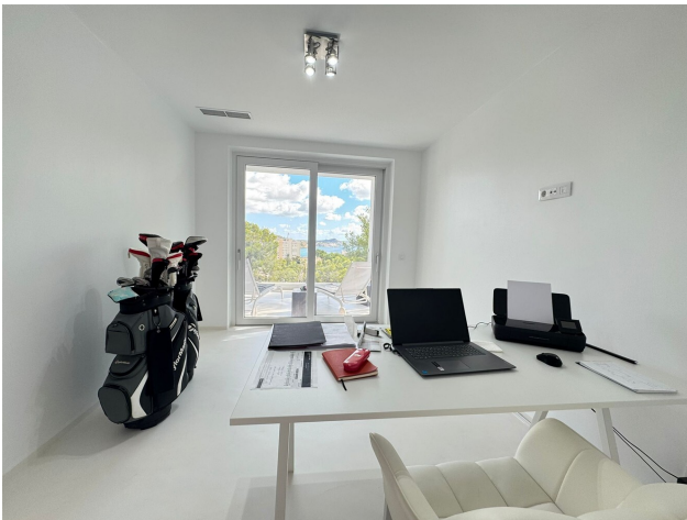
Moderne Villa Mallorca