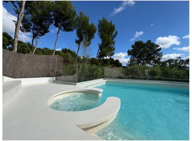
kaufen Villa Mallorca