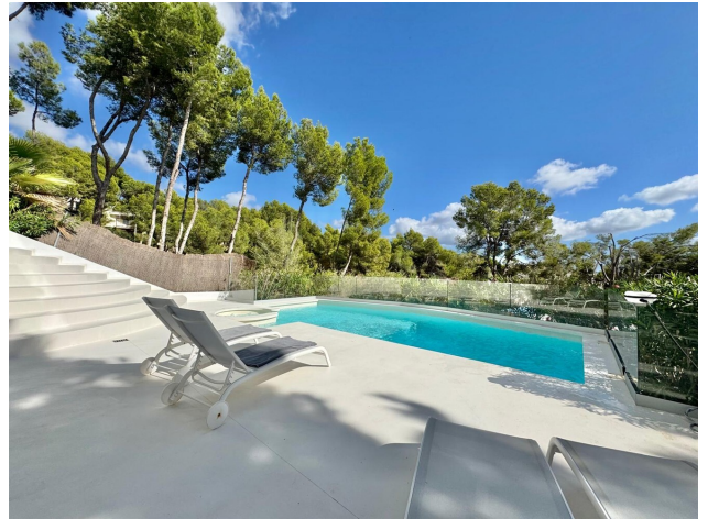
Mallorca Villa Meerblick