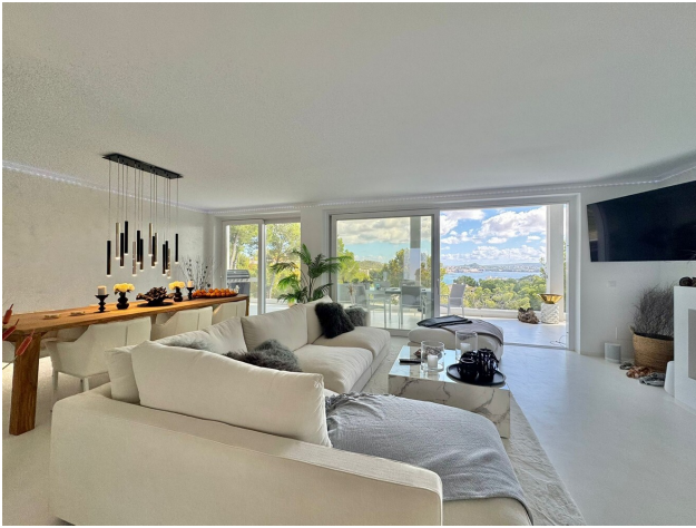
sea view Villa