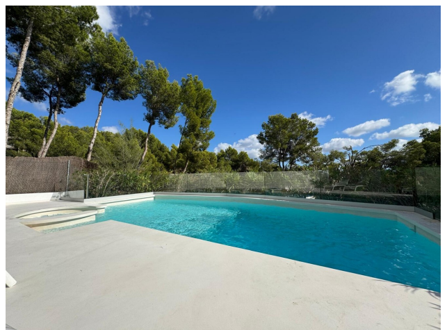
Kaufen Mallorca Immobilien