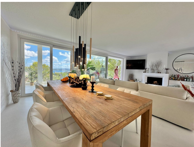
Modern Design Villa