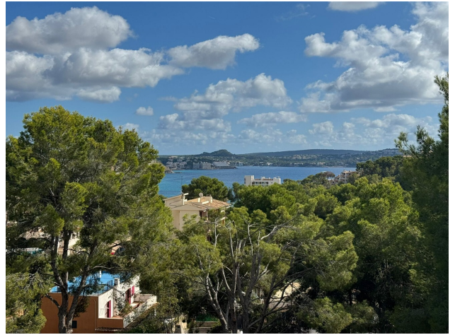
moderne Villa kaufen