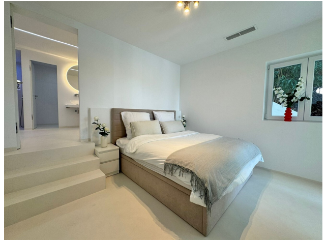
Sea View Paguera