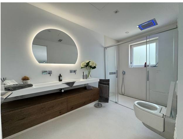
Modern villa Majorca