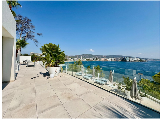
terrace living are