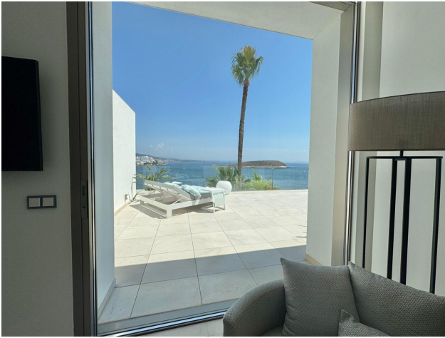
Master Bed view