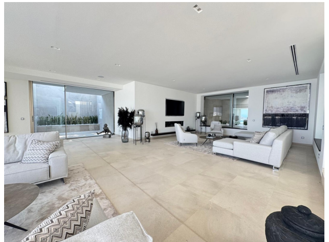
living area 1