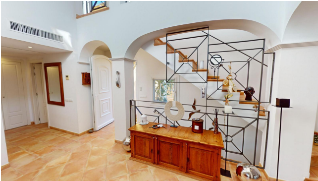
kaufen Camp de Mar