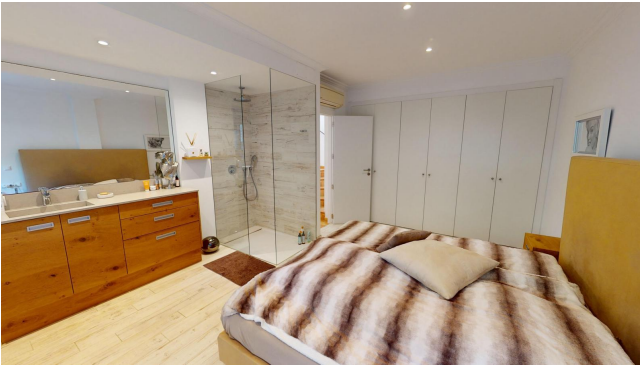
Mallorca Immobilie kaufen