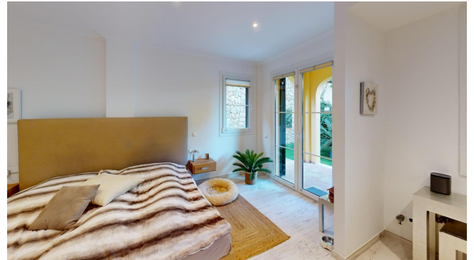
kaufen Haus Wohnanlage