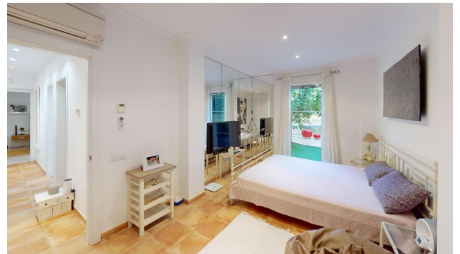
Camp de Mar