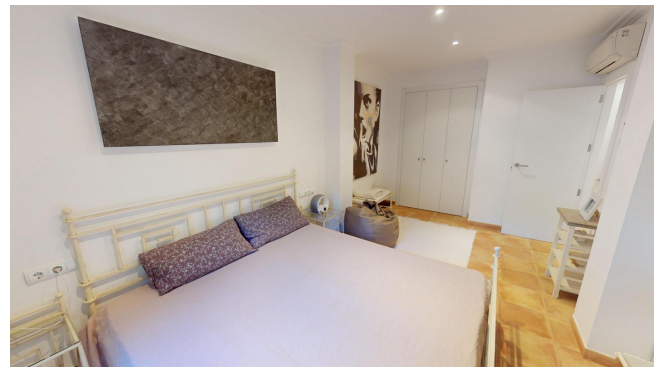
Reihenhaus Camp de Mar