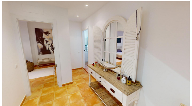
house for sale Majorca