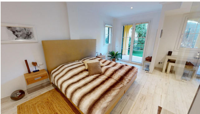
kaufen Golf Haus