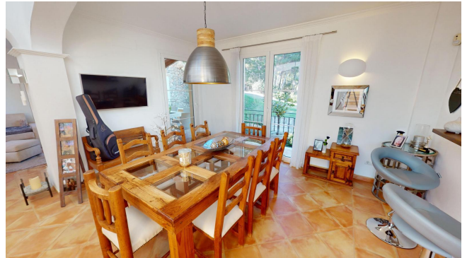
kaufen Mallorca Immobilien