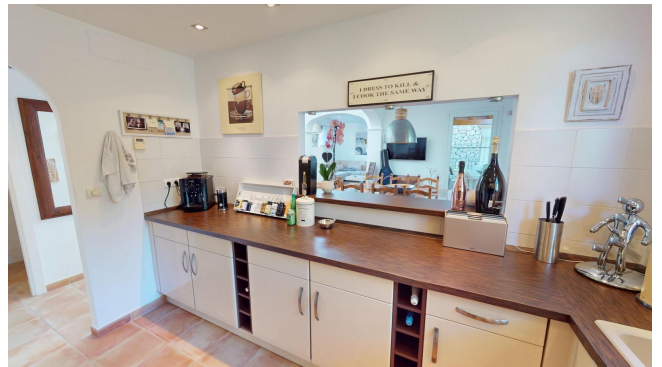
kaufen Haus Golplatz