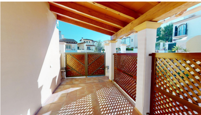
Camp de Mar Haus