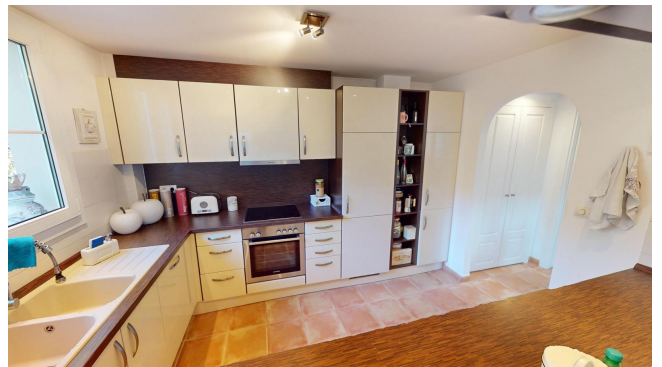
Kaufen Camp de Mar