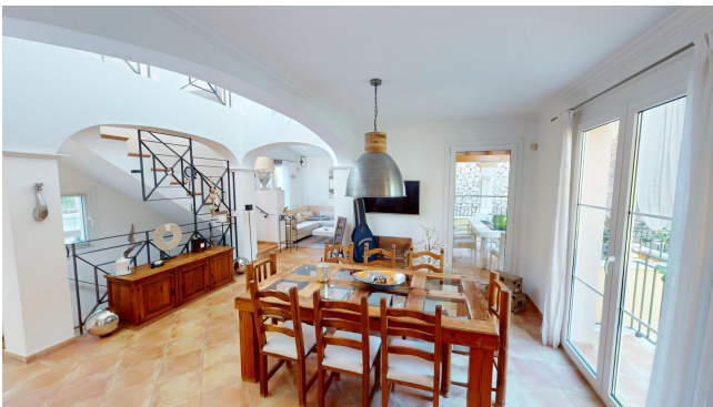
kaufen Mallorca Strand