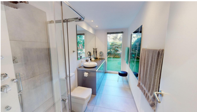
for sale Camp de Mar