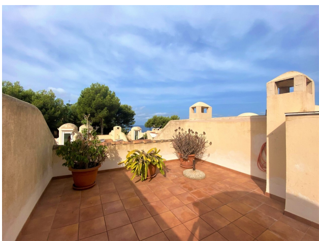
Dachterasse Santa Ponsa