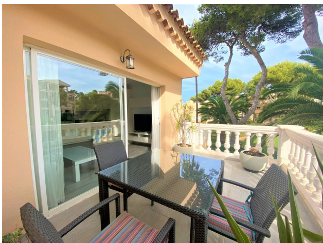
Penthaus kaufen Mallorca