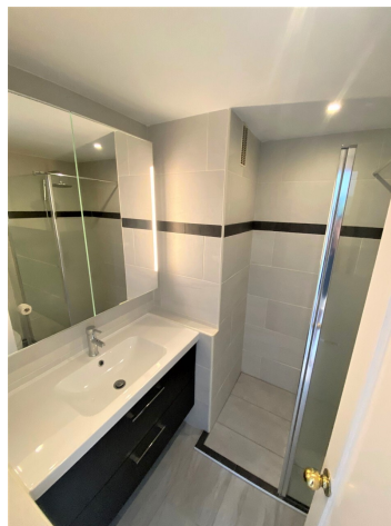
Immobilie kaufen Santa Ponsa