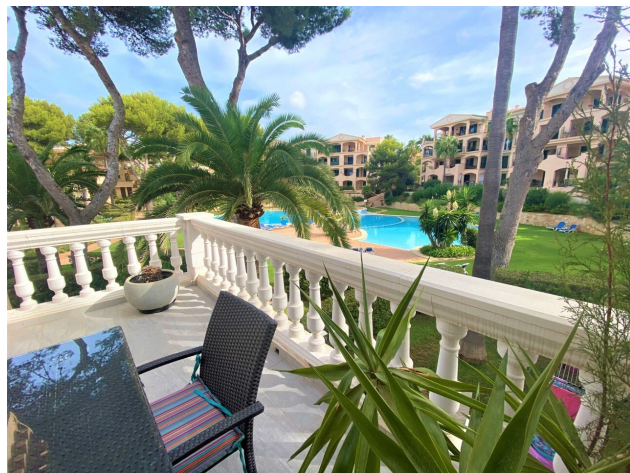
Penthaus Santa Ponsa