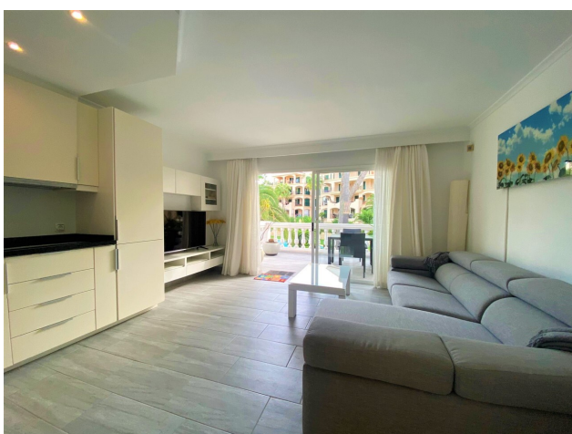
kaufen Santa Ponsa