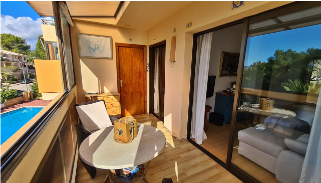
Apartment La Romana