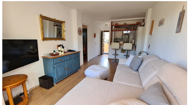
Apt. mit Pool Mallorca