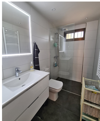
Wohnung Südwesten Mallorca