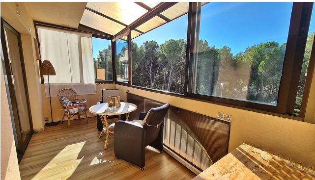
Apartment mit Gemeinschaftspool