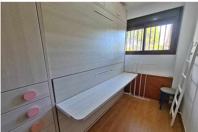
Wohnung mit Pool Paguera