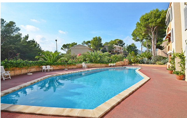
schöne Wohnung Paguera