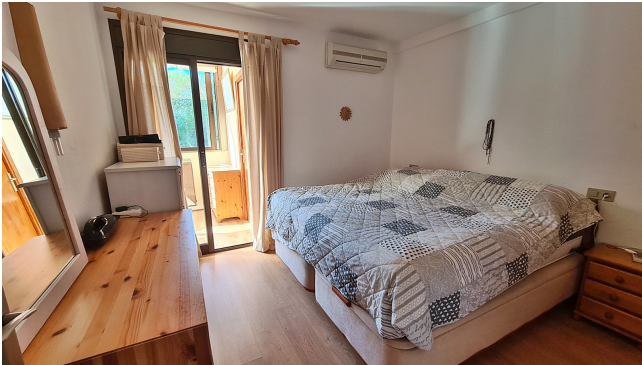
Wohnung mit Pool Mallorca