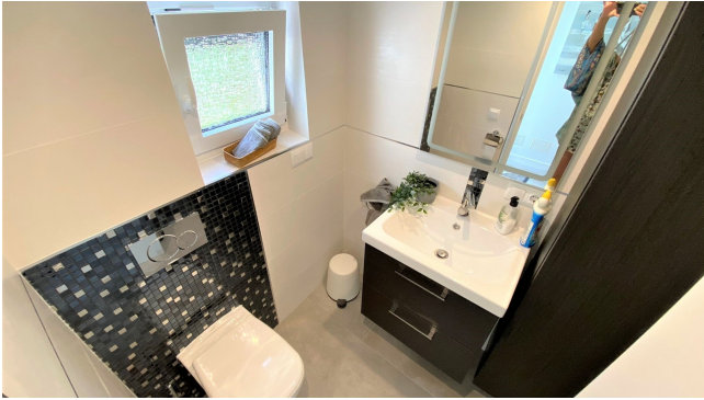
kaufen Villa Mallorca