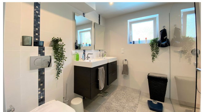
Villa renoviert El Toro