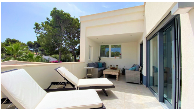
kaufen El Toro