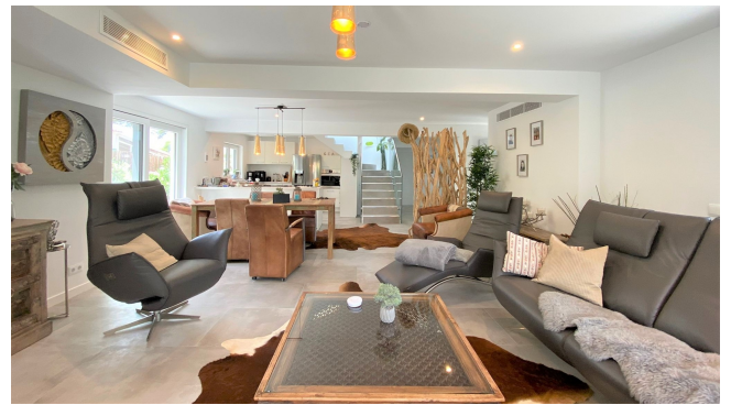
Port Adriano kaufen