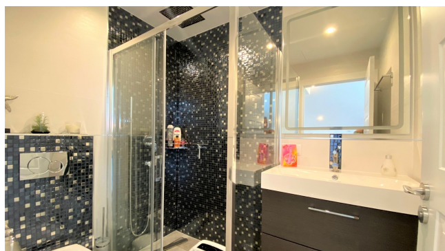
kaufen Villa Port Adriano