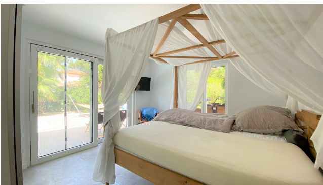
kaufen Villa Mallorca