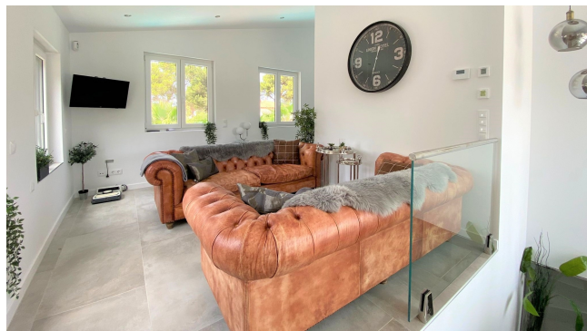
kaufen Port Adriano