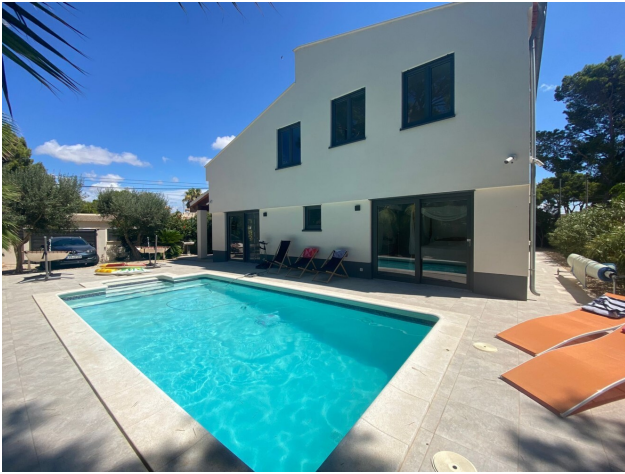
Villa kaufen Port Adriano