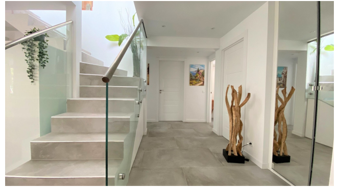
kaufen Villa Mallorca