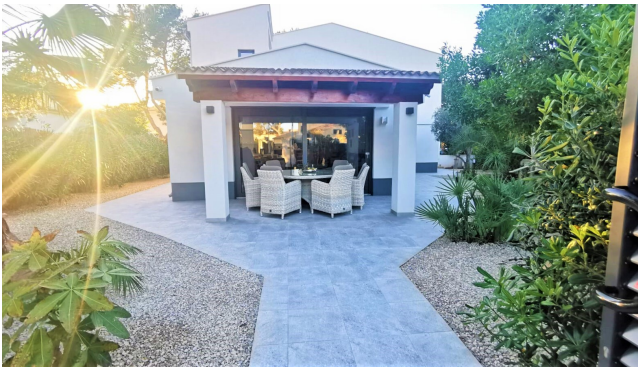
Mallorca Port Adriano