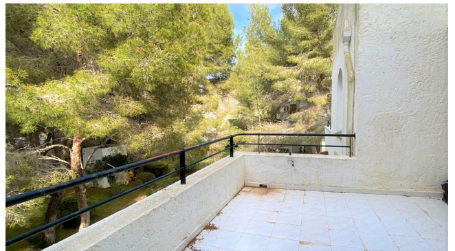
Mallorca for sale house