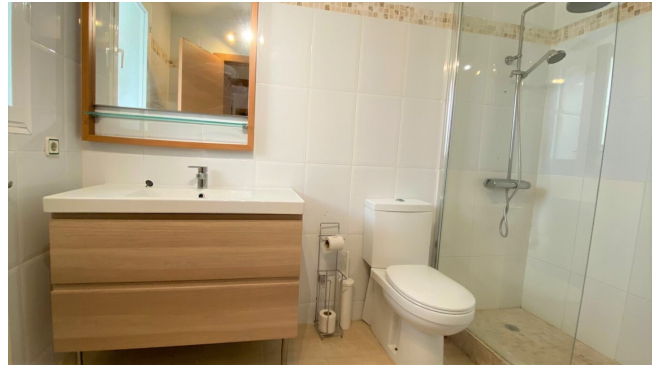
kaufen Sol de Mallorca