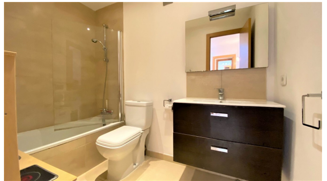
Mallorca Immobilien kaufen