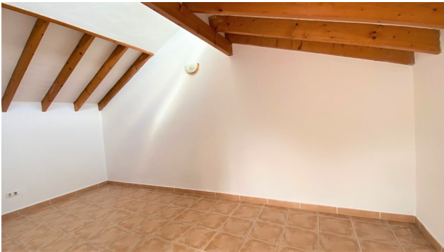
for sale Sol de Mallorca