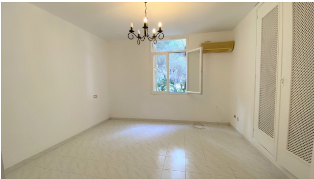
Reihenhaus kaufen Mallorca