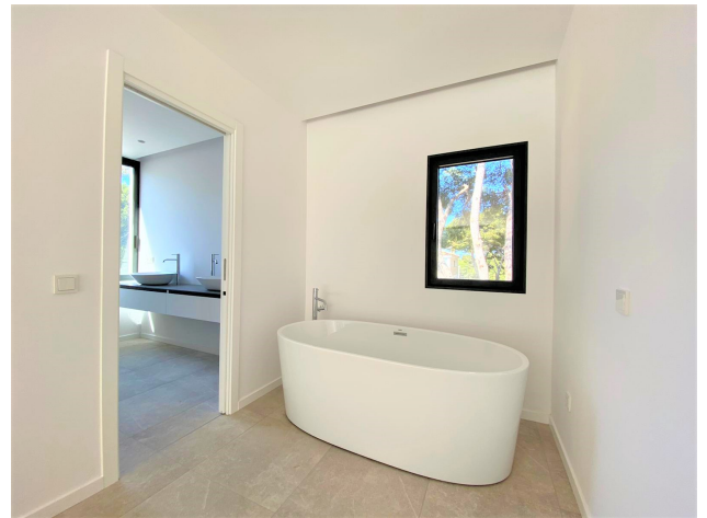
kaufen Neubau Santa Ponsa