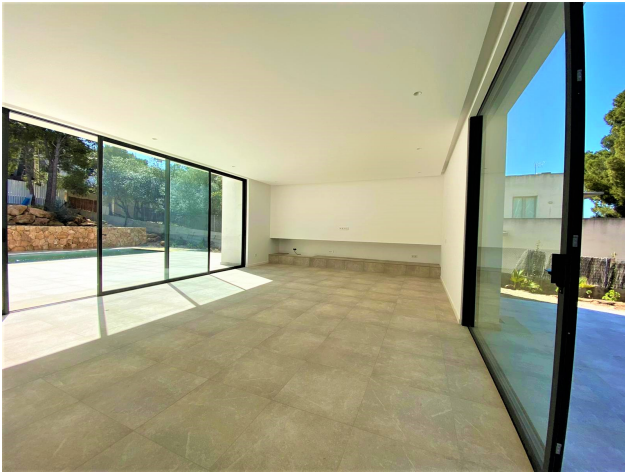
Neubau kaufen Mallorca