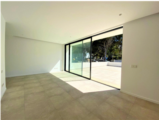
Mallorca Villa kaufen