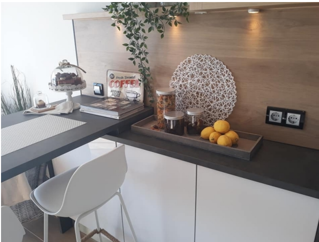
Studio mit Meerblick