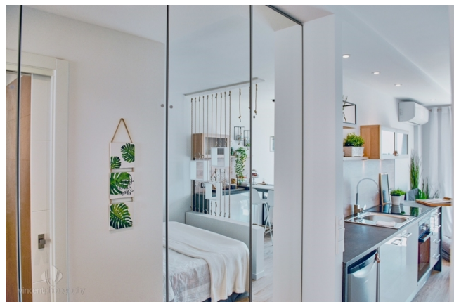
Studio kaufen Mallorca