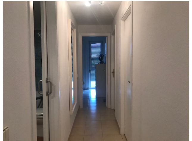
zu vermieten Mallorca