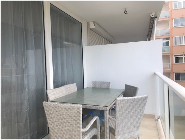
Miete El Toro