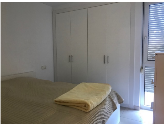
Apartmen mieten Mallorca