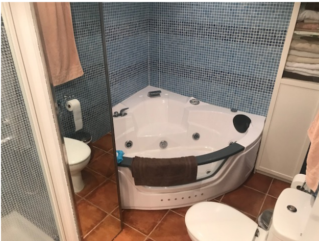
mieren Port Adriano