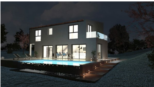
Bauen El Toro