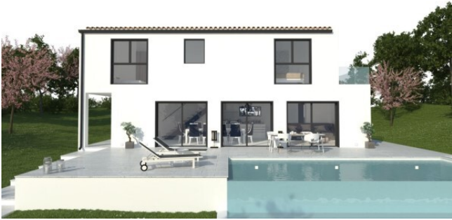
bauen auf Mallorca