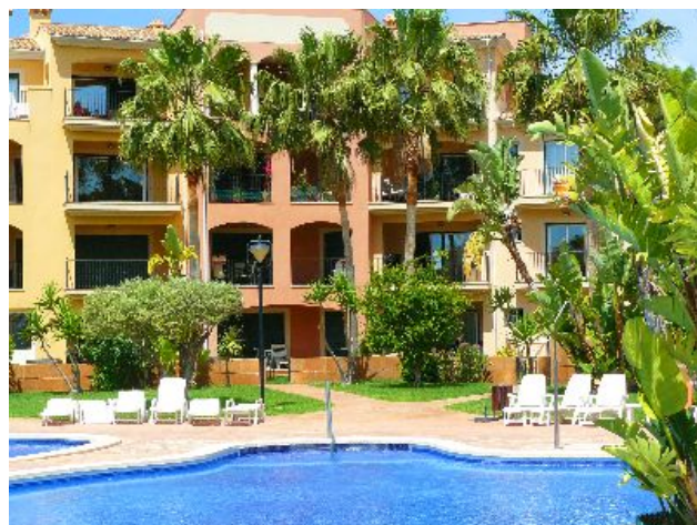
Santa Ponsa Miete