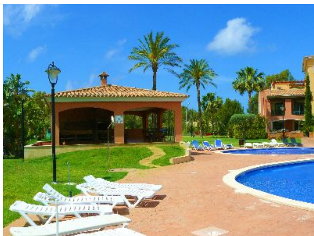
Rental Santa Ponsa