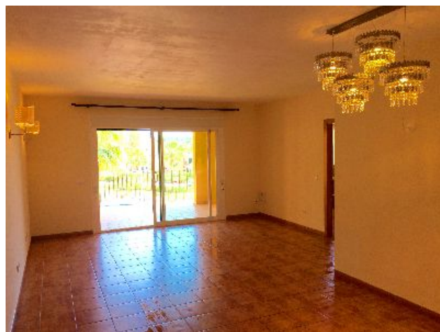
Apartment zur Miete