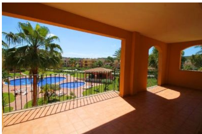
Terrasse mit Blick