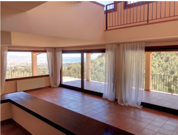
Meerblick Son Vida