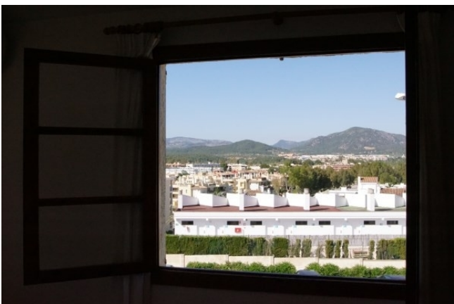
Santa Ponsa Kauf