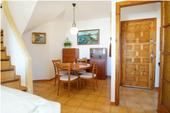
Esszimmer Kauf in Santa Ponsa