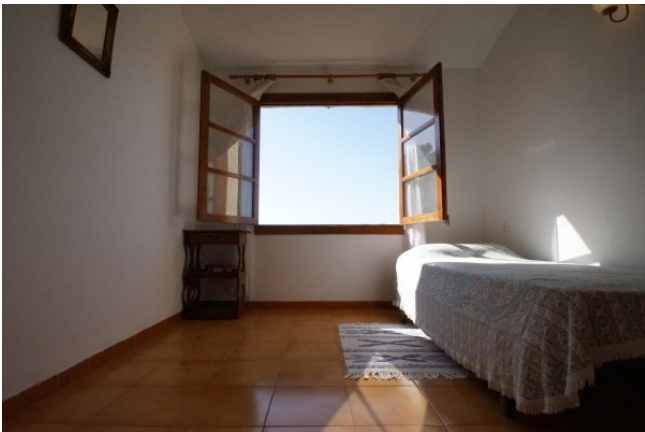
Kleines Schlafzimmer Kauf