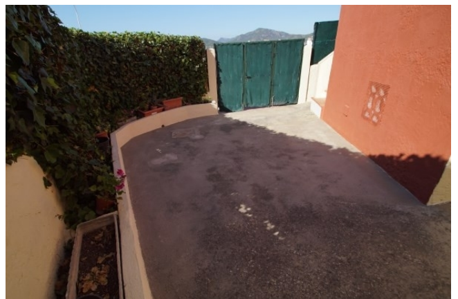
Reihenhaus in Santa Ponsa