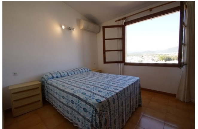
Schlafzimmer in Santa Ponsa Kauf