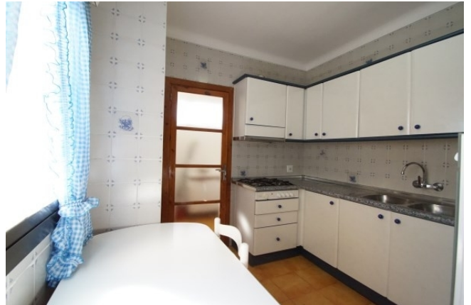
Kauf Santa Ponsa Küche