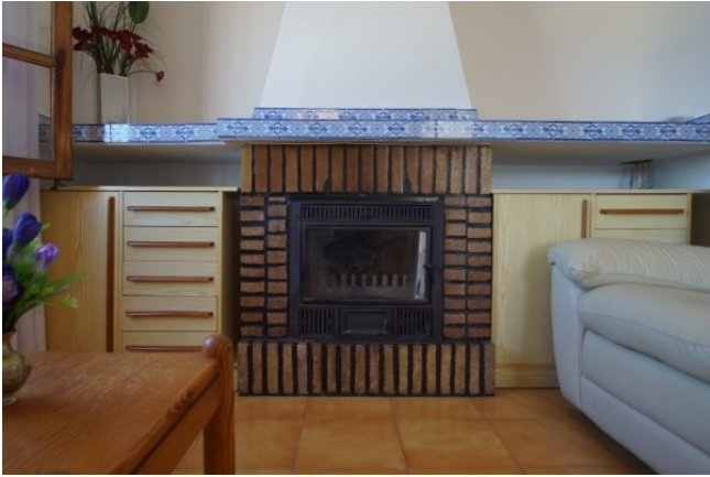
Reihenhaus mit Kamin Santa Ponsa