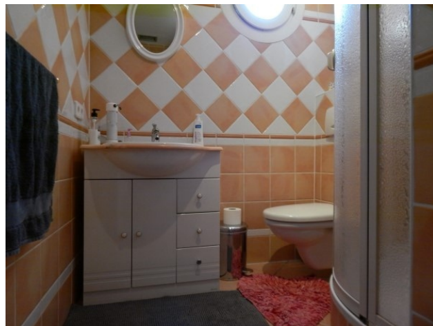
7 Bad kl. unten mit Dusche