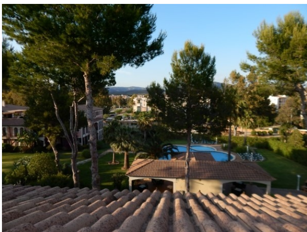
9 Blick von der Dachterrasse