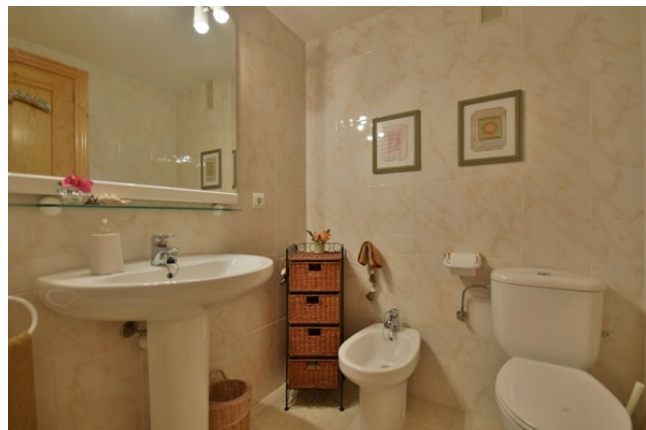
16 Second bathroom 2