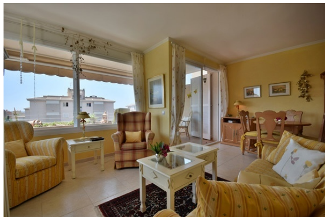
03 Living dining room