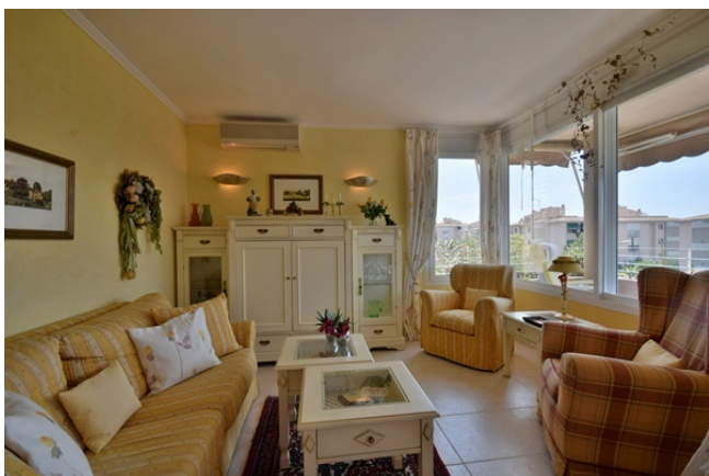
04 Living room