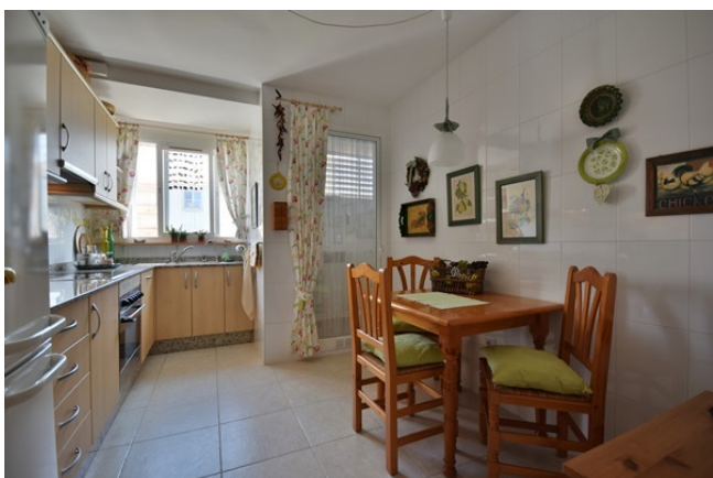
06 Kitchen with utility room