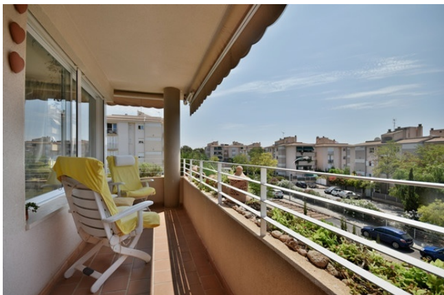
02 Covered terrace