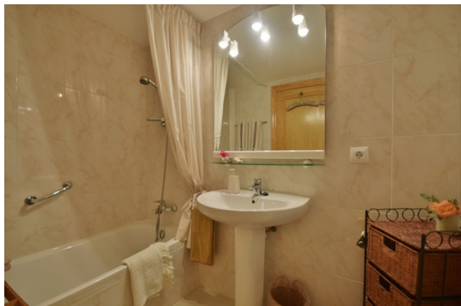
15 Second bathroom 1