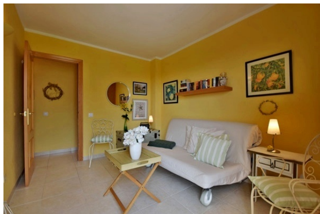
14 Third bedroom