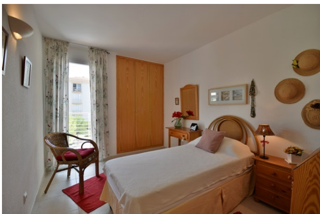
10 Second bedroom with balcony