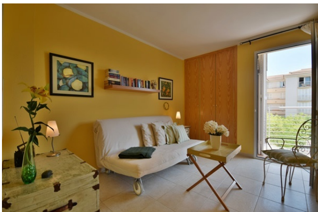
13 Third bedroom with balcony