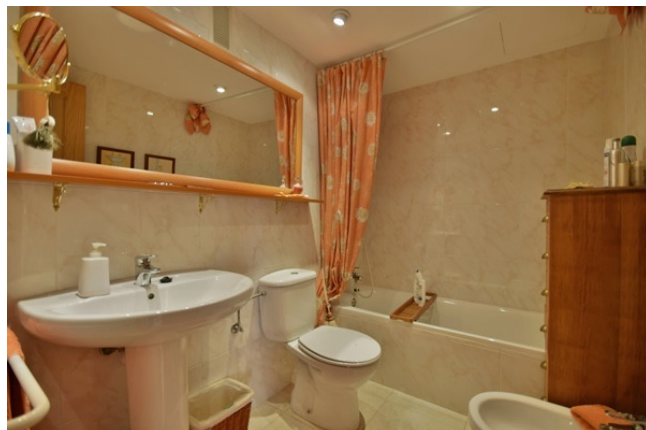
09 Master bathroom en suite