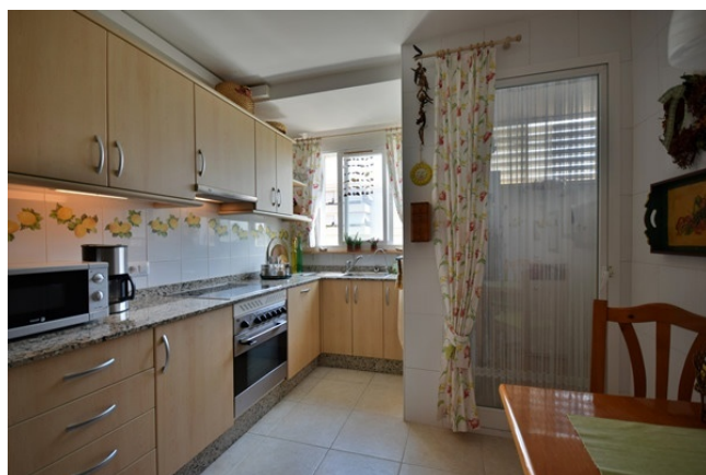
07 Kitchen with laundry