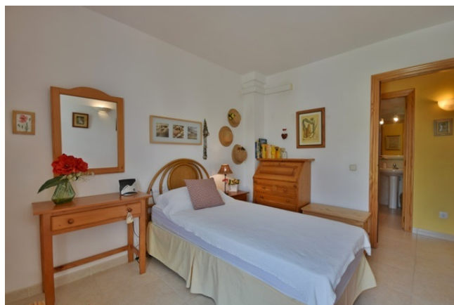
11 Second bedroom