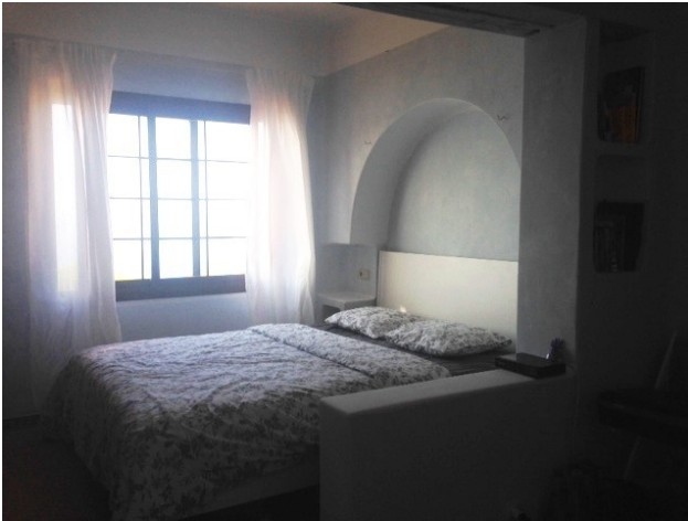
Schlafbereich Cala Fornells