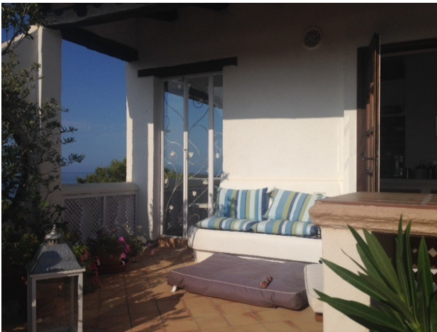
Terrasse Cala Fornells