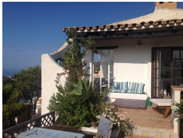
Terr Cala Fornells