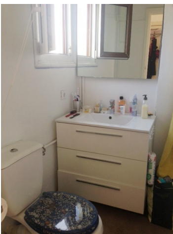
Bad Cala Fornells