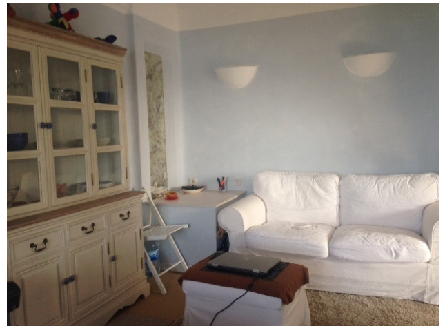
Wohn und Schlafbereich