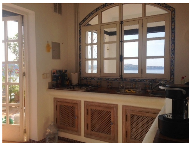
Küche Cala Fornells