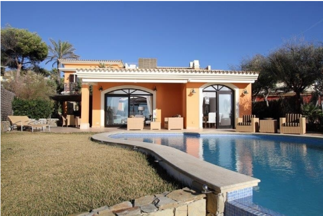
Fassade Ville erste Linie Sta. Ponsa